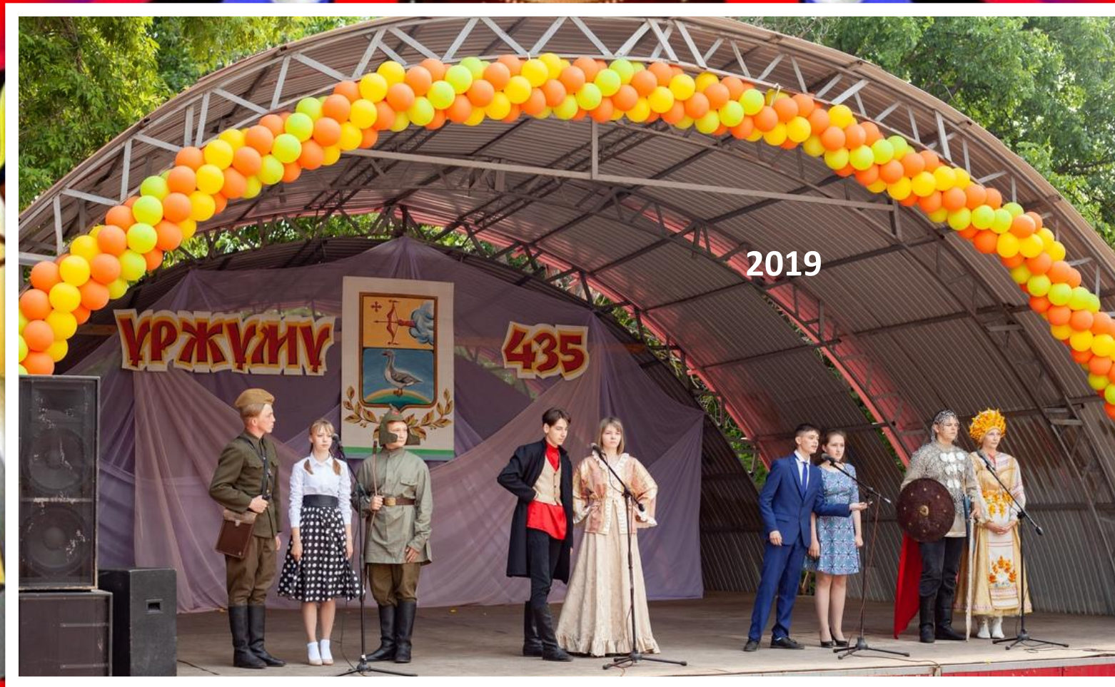
Лейтенант в поэтическом театре «Страницы истории Уржума»