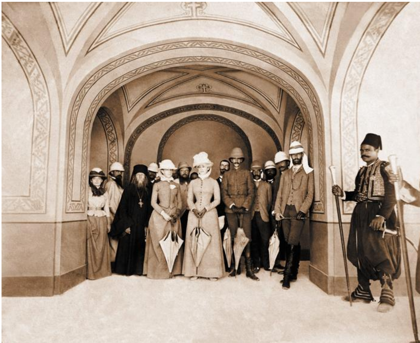
Сергей Александрович и Елизавета Федоровна на Святой земле.

Гетсимания, храм святой Марии Магдалины, 1888