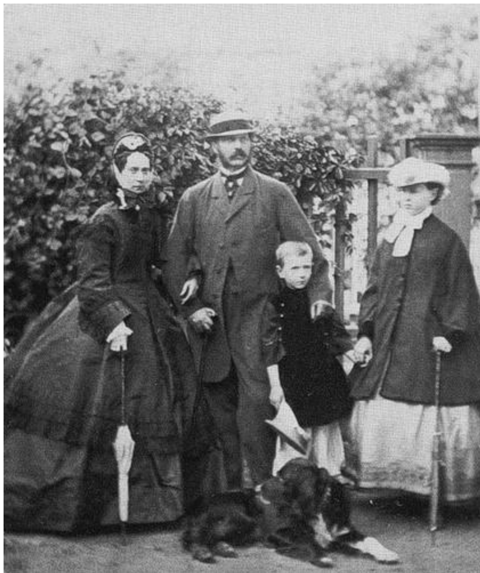
Александр II и Мария Александровна с сыном Сергеем