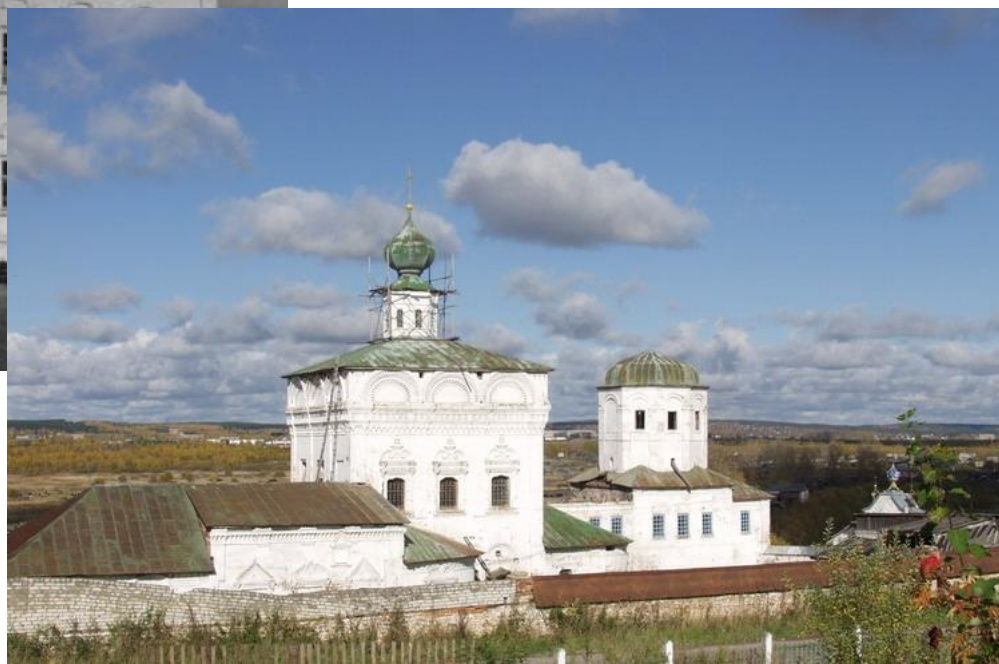
Вознесенская церковь Соликамск