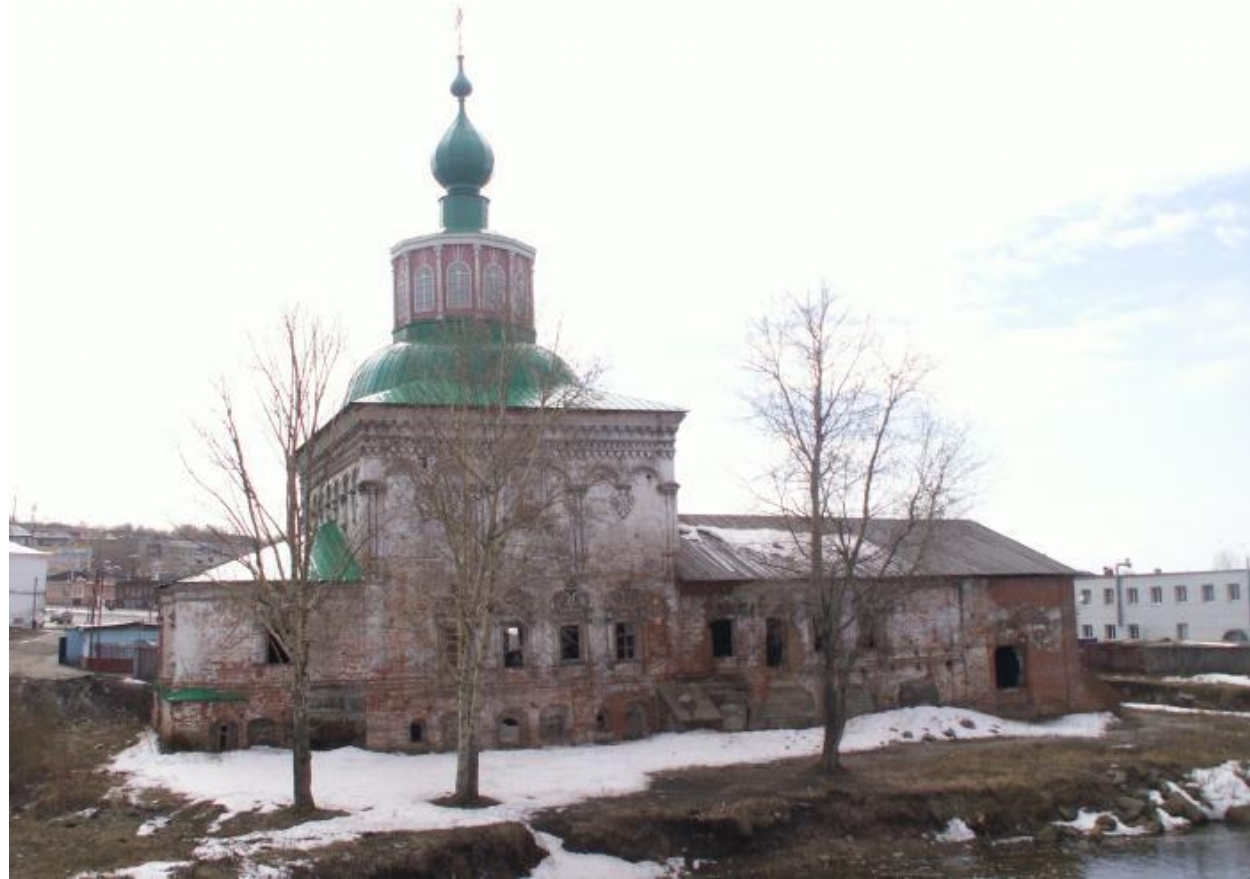
Крестовоздвиженский собор Соликамск