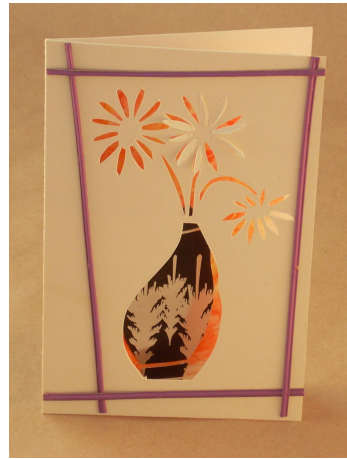
Быкасов Кирилл. 3 класс

Учащиеся экспериментируют с изготовлением разных фактур бумаги для достижения большей выразительности рисунка.