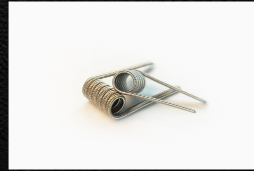
Alien Fused Clapton \Omega=0,30 \text{ Ом} 3x0, 4Ka+0, 1Ni80 6 ВИТКОВ

Каждый вид коилов есть в двух вариациях под ПЛАТУ или под МБУМОП