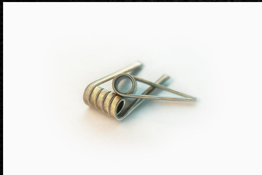
Quad Fused Clapton \Omega=0,18 \text{ Ом} 4x0, 4Ni80+0, 1Ni80 5 витков на 3 мм оправу