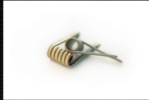
Triple Fused Clapton \Omega=0,2 \text{ Ом} 3x0, 4Ni+0, 1Ni80 6 витков на 3 мм оправу