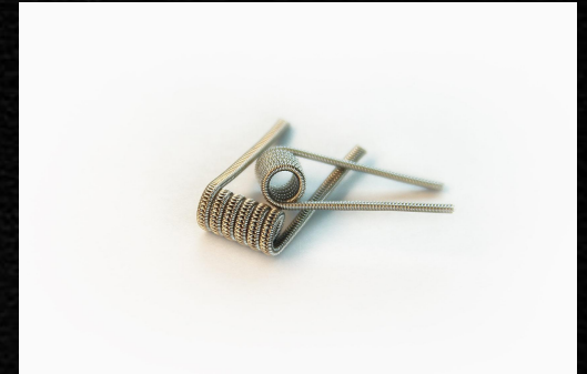
Staggered Fused Clapton \Omega=0,30 \text{ Ом} 2x0, 4Ni80+0, 15Ni80 6 витков на 2,5 мм оправу