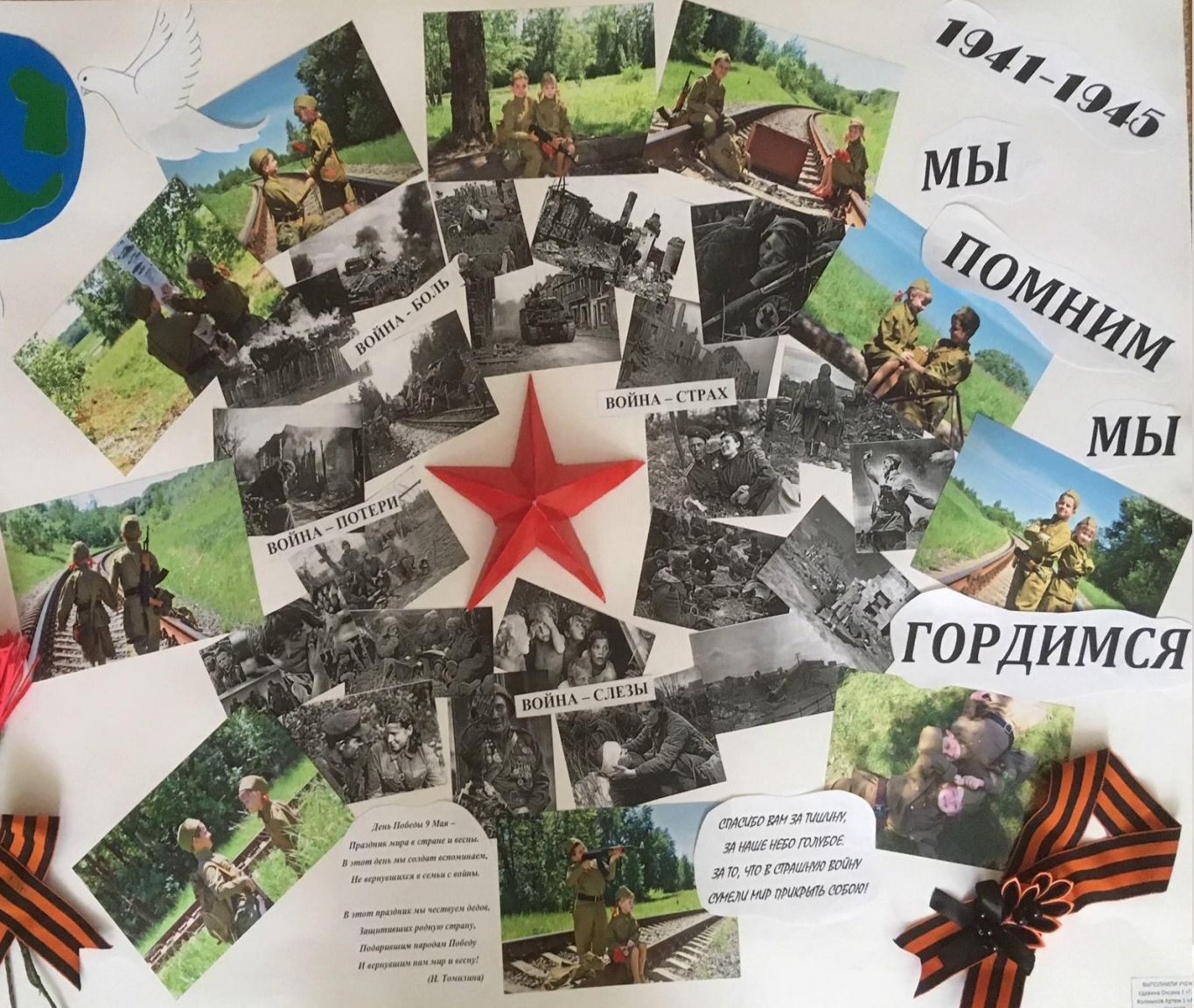
ВОЙНА - БОЛЬ