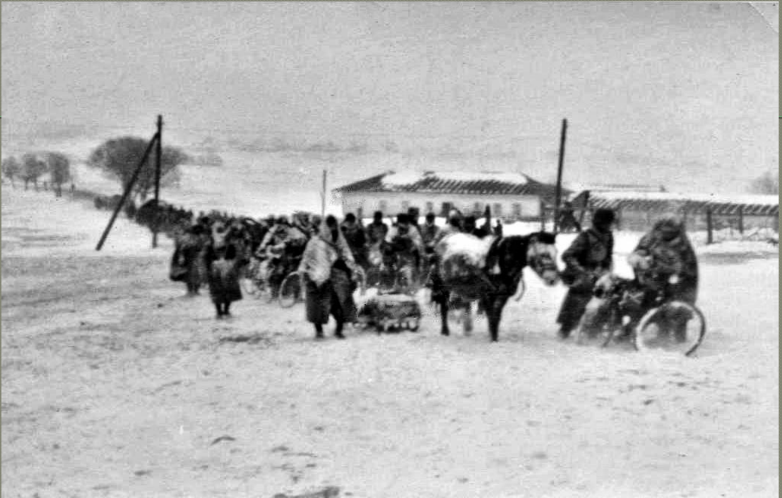
Конно-велосипедная колонна немецкой 112-й пехотной дивизии в г Донском. Предположительно 12 декабря 1941 года