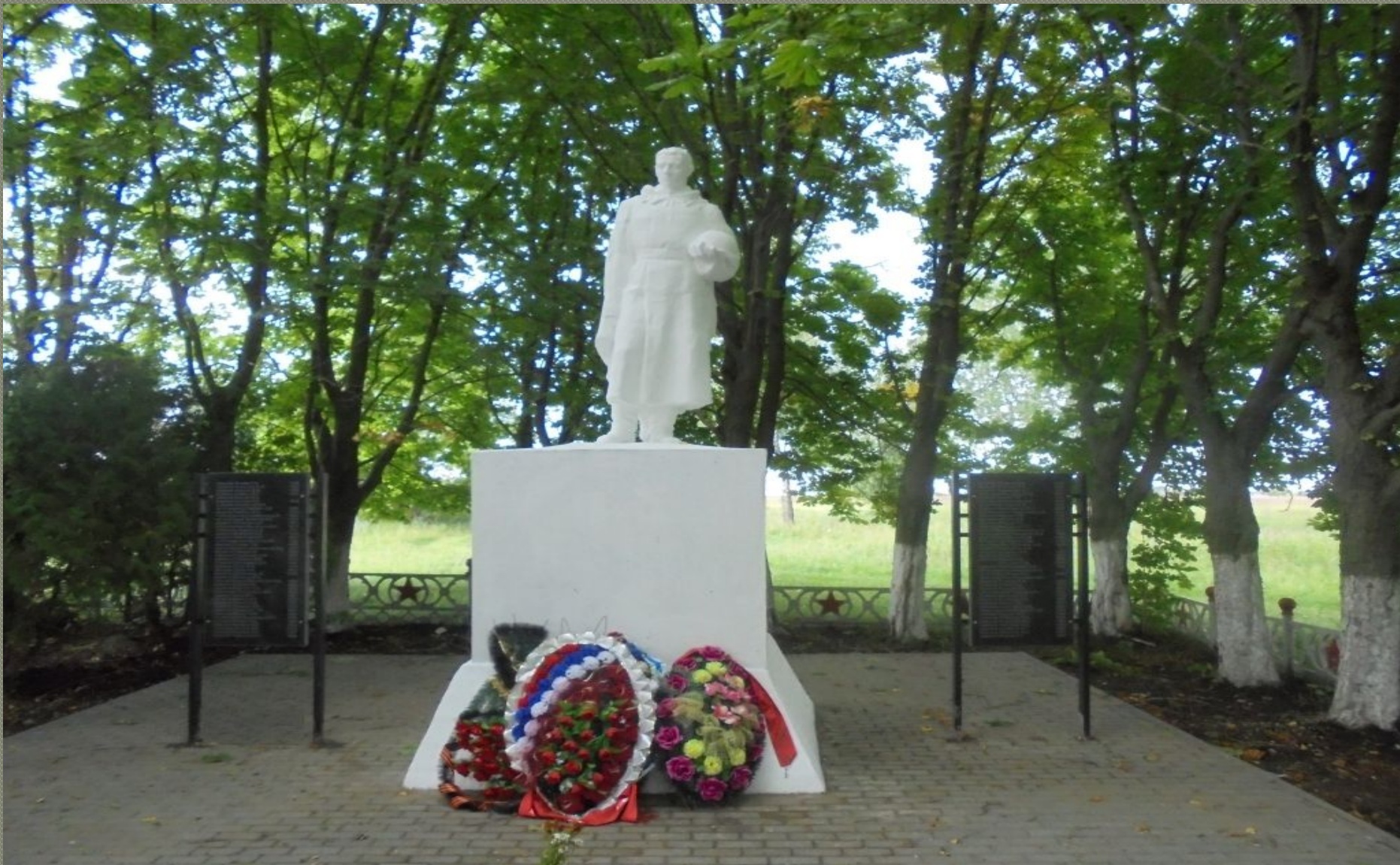
Фигура воина с непокрытой головой у братской могилы поселка Шахты №19. Памятник установлен 9 апреля 1969 г