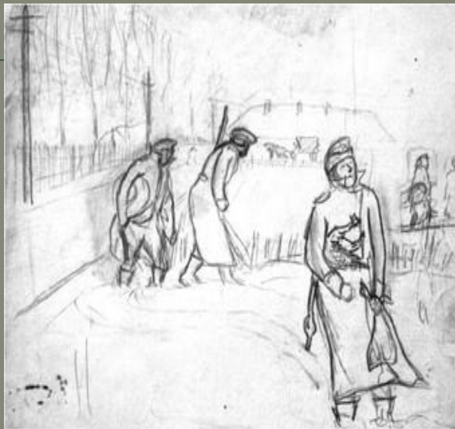
Рисунок Г. Хмелева.