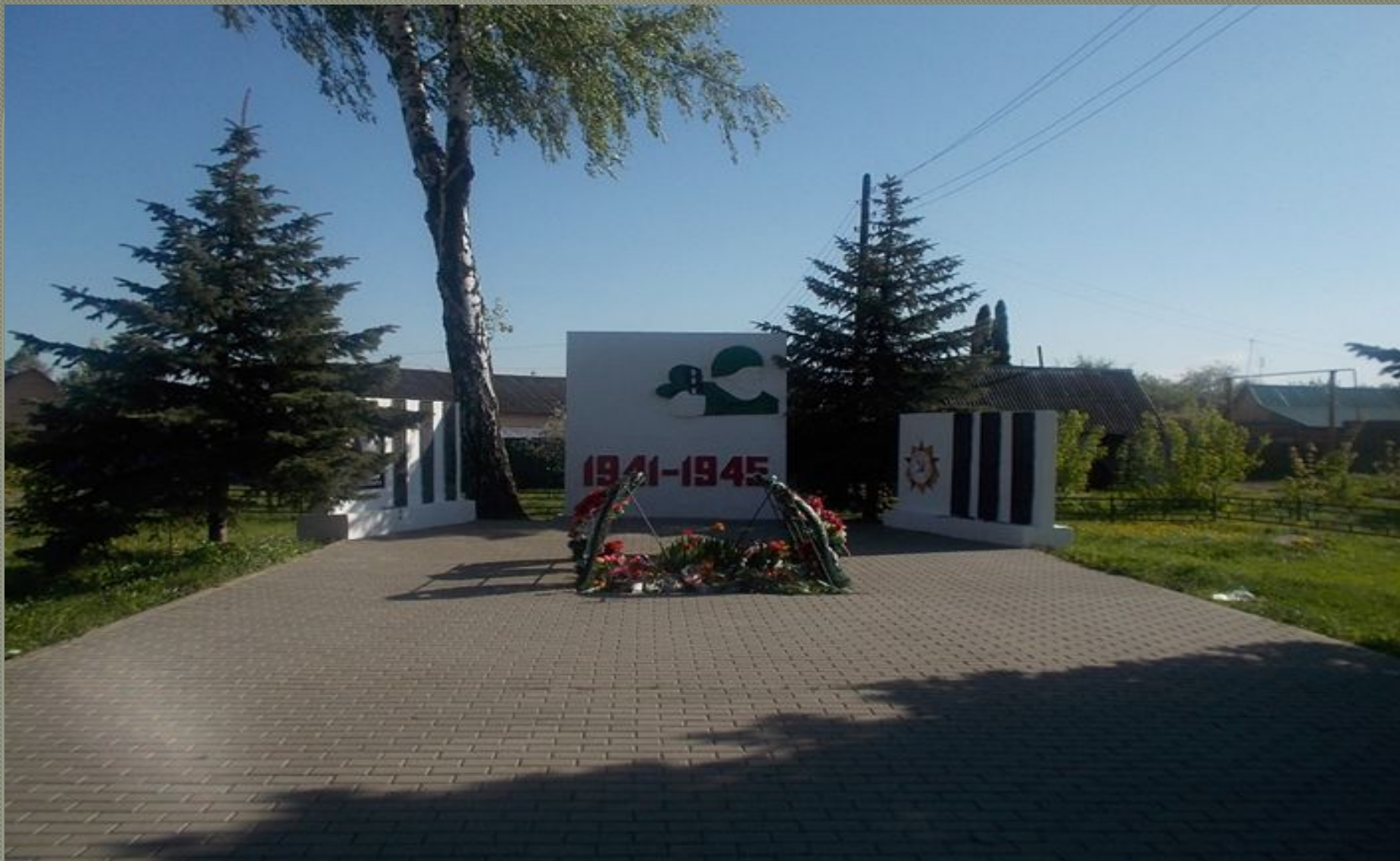
Памятный знак с изображением воина с автоматом у братской могилы микрорайона Руднев.