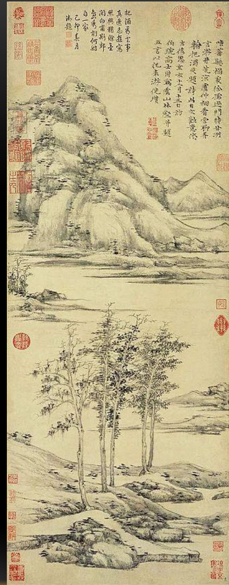
Ни Цзань «Деревья и долины горы»