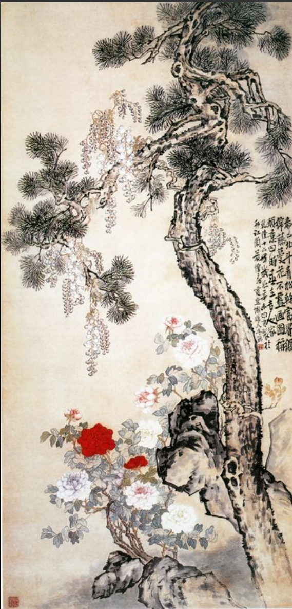
Ли Шань «Сосна и глициния»