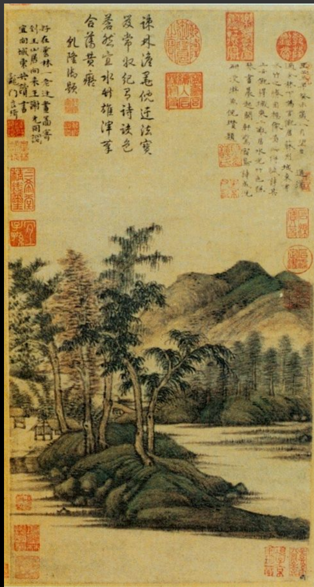
Ни Цзань. Воды и бамбуковый домик. 1343