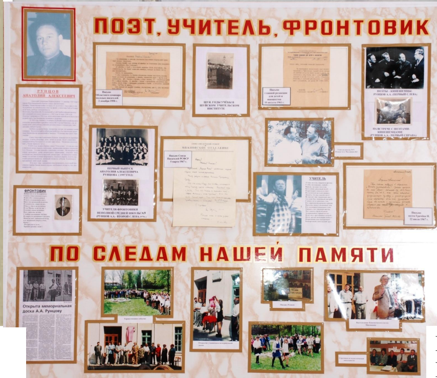
Стенд, посвященный А. Рунцову