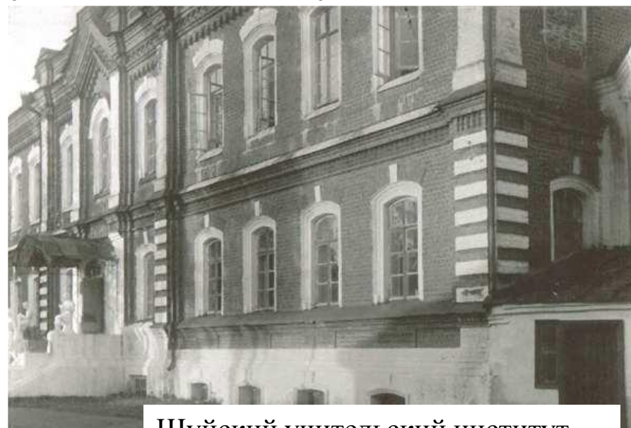
Шуйский учительский институт