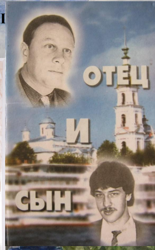
Книга издана в год 55-летия Победы в Вов и 20-летия со дня смерти поэта, как светлая дань памяти.