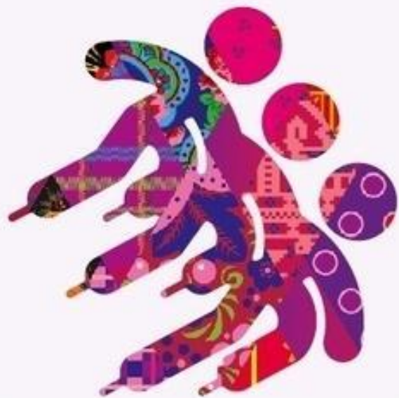
Шорт - трек