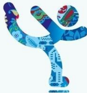
Фигурное катание на коньках