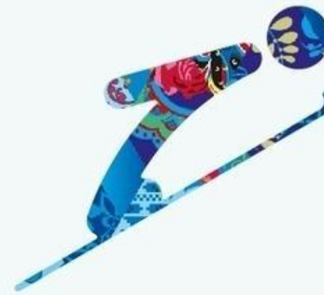
Прыжки на лыжах с трамплина