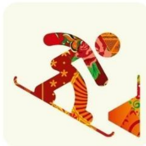
Сноуборд параллельные виды