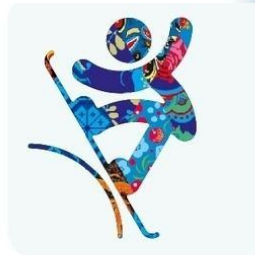
Сноуборд - Слоупстайл