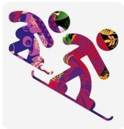
Сноуборд - кросс