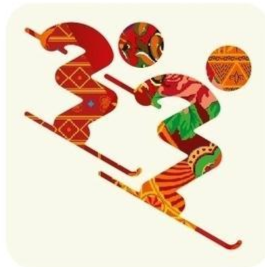
Фристайл - Ски-кросс