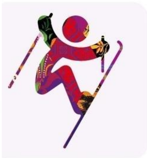
Фристайл - Хафпайп