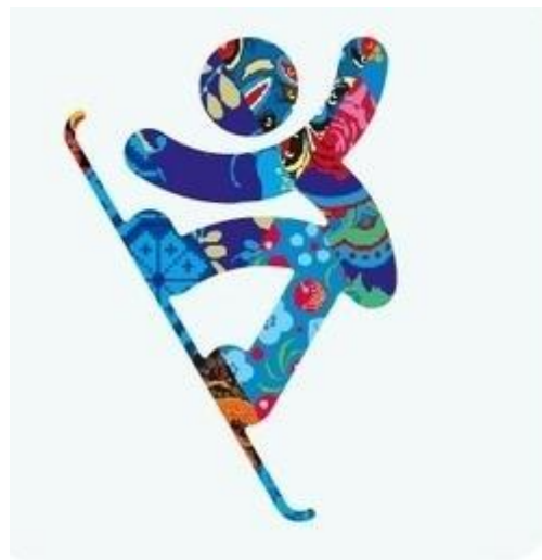
Сноуборд - Хафпайп