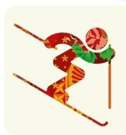
Фристайл - Могул