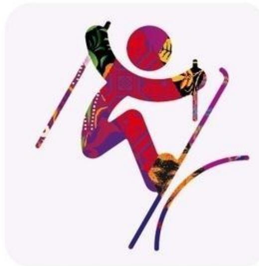
Фристайл - Слоупстайл