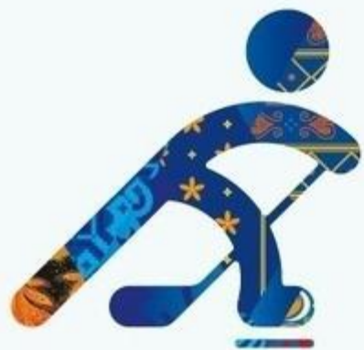
Хоккей на льду