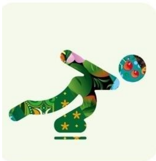
Скоростной бег на коньках