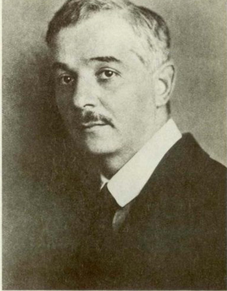
Саша Черный. Фотография из Берлинского издания «Сатир», 1922 г.