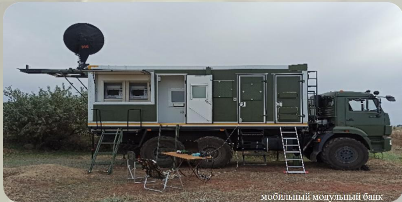
мобильный модульный банк