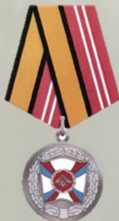
МЕДАЛЬ "ЗА УКРЕПЛЕНИЕ БОЕВОГО СОДРУЖЕСТВА"