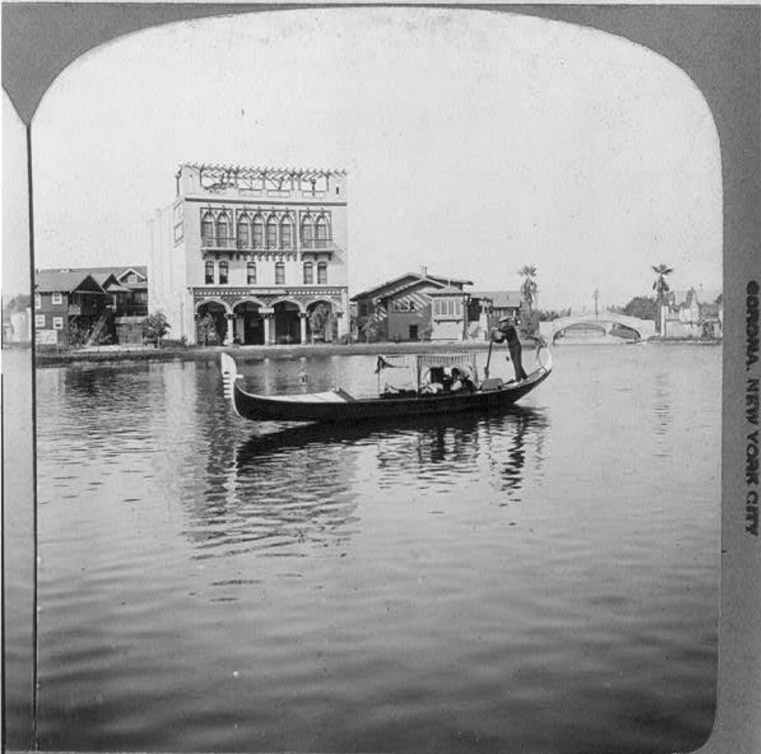
7 Venice, a seaside city near Los Angeles, Cal.