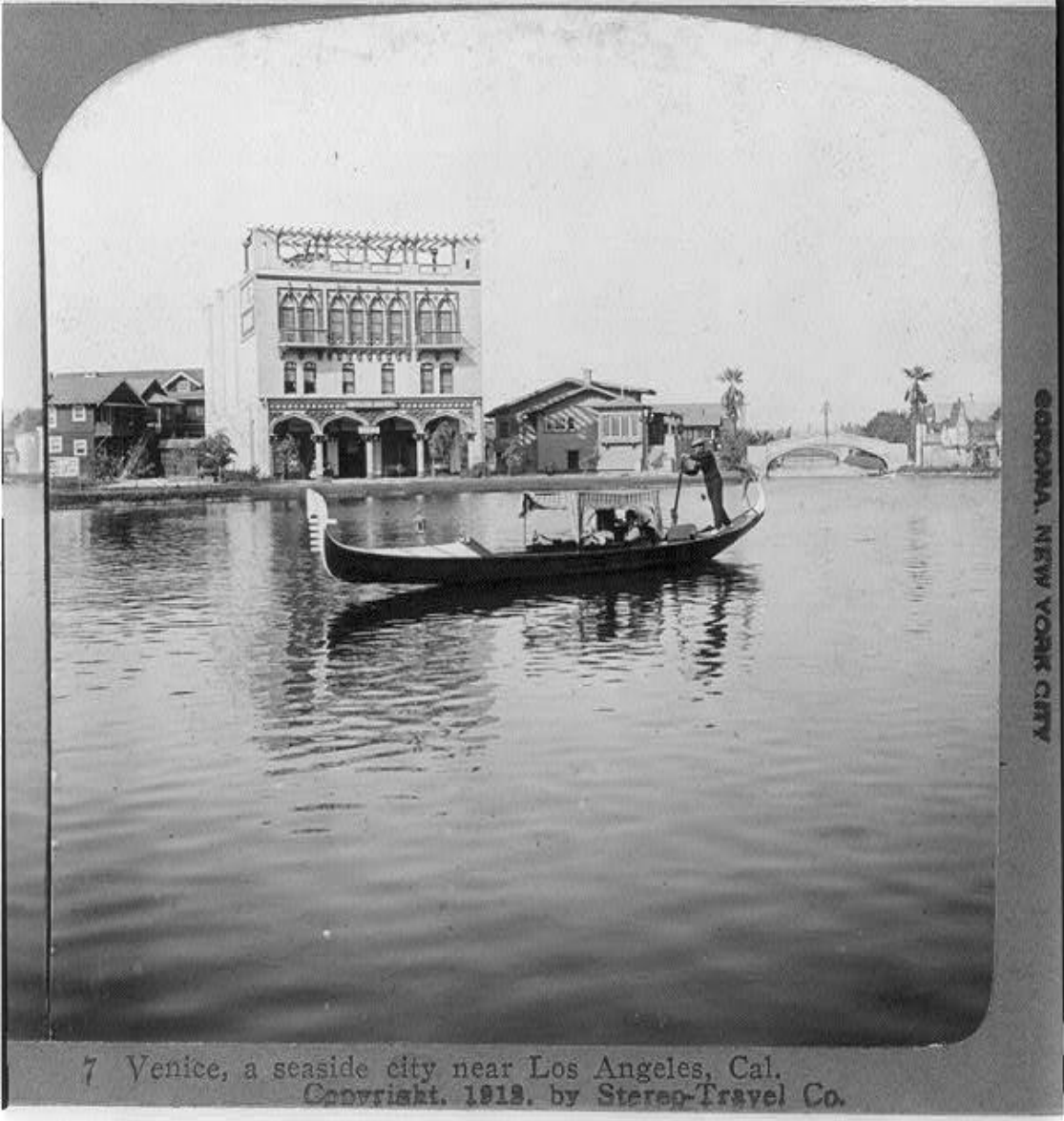
7 Venice, a seaside city near Los Angeles, Cal.