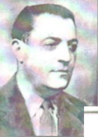
ЦЕГЕРАТЫ МАКСИМ • 1916—1990