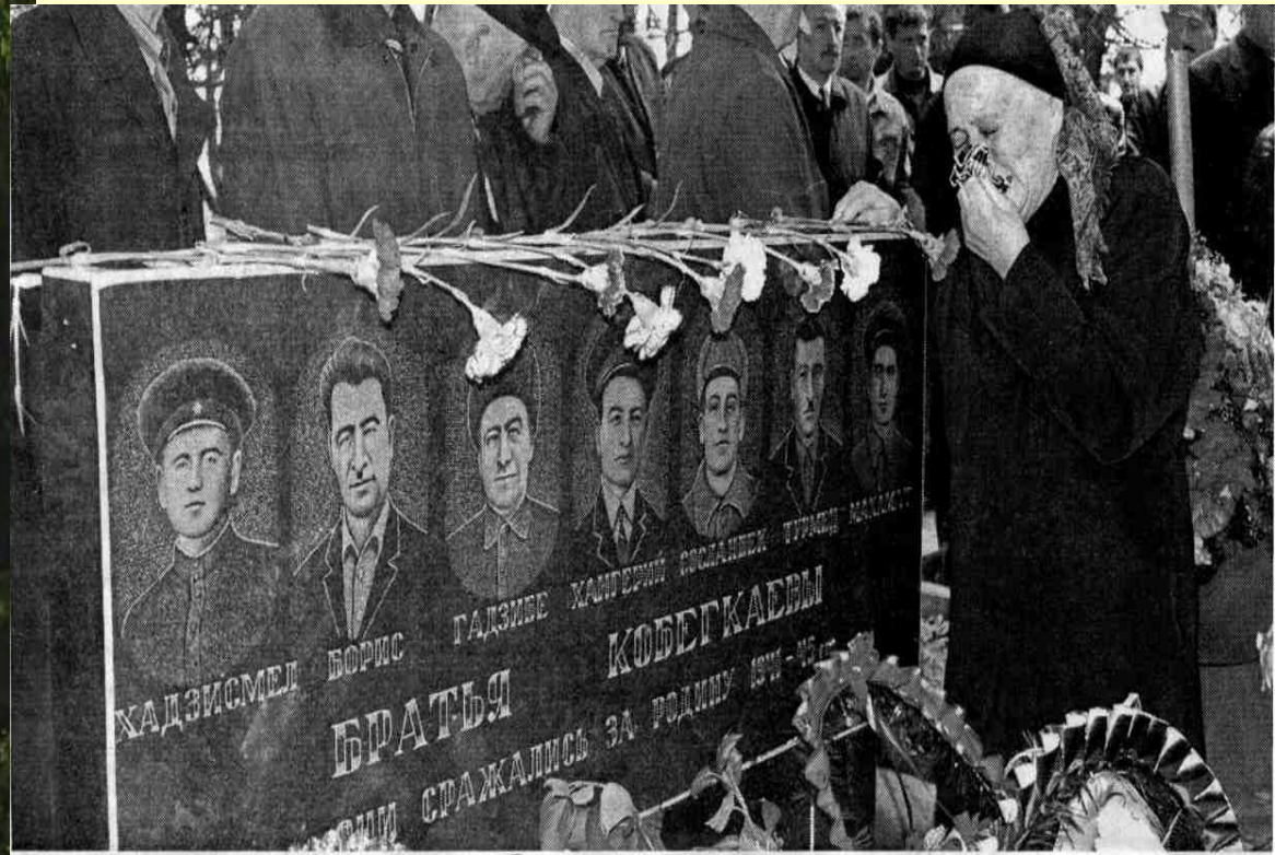
КОБЕККАТЫ 7 АФСЫМАЭРЫ