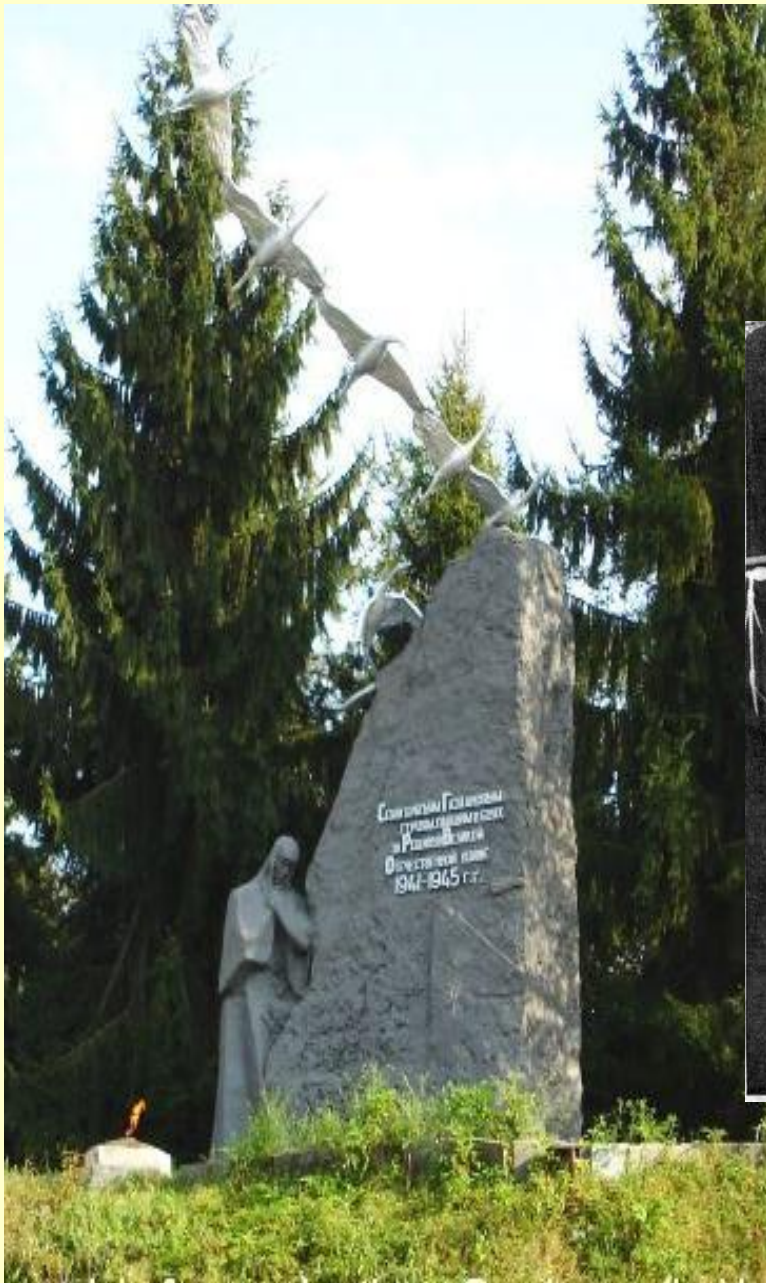
ГАЭЗДАЭНТЫ 7 АФСЫМАЭРЫ