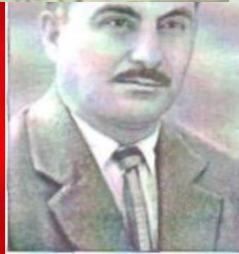
МЫРТАЗТЫ БАРИС • 1917—1996