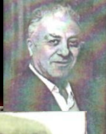
ПЛИТЫ ГРИС • 1913—1999