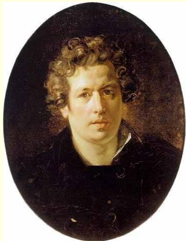
К. П. Брюллов, автопортрет