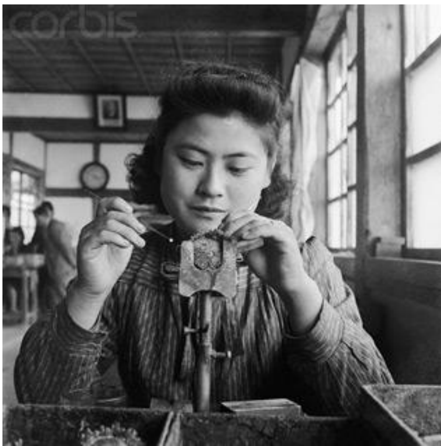
Рисунок - Микимото за работой [12]

Рисунок – Работа на предприятии Микимото в середине 20 в. [12]