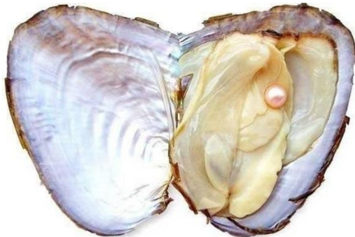
Рисунок – Культивируемый жемчуг в теле моллюска [10]