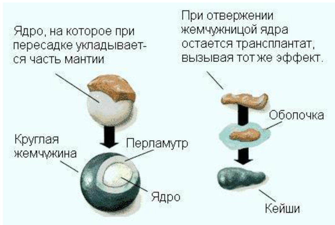
Рисунок – Схема выращивания культивируемого жемчуга [15]