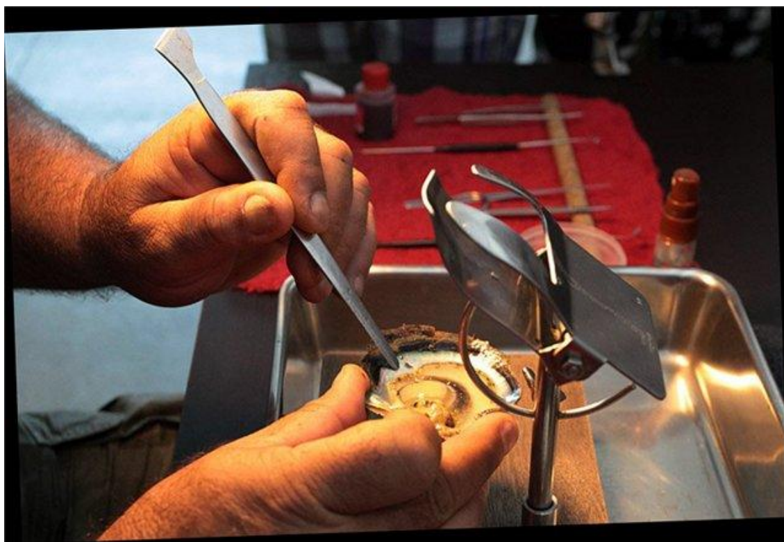
Рисунок – Раковина - донор[ 16 ]

Одна раковина будет донором. От нее отрезают кусочек мантии, который помещают потом на имплант. Он будет катализатором процесса.