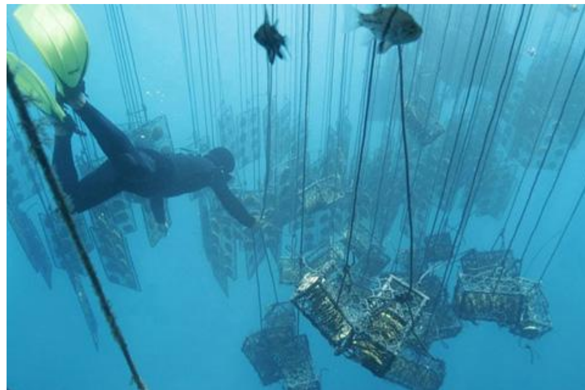
Рисунок – Подъем моллюсков на поверхность 1 Рисунок – Подъем моллюсков на поверхность [ 14 ]