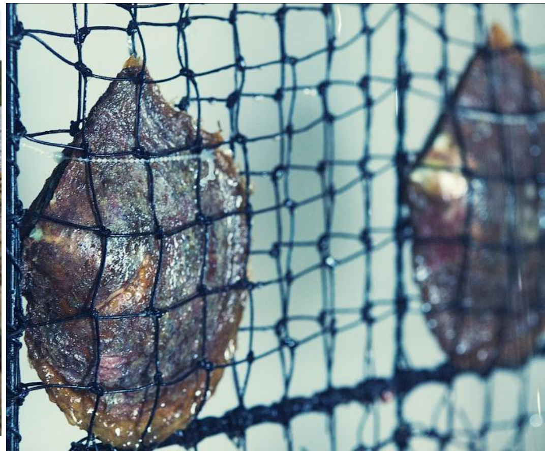
Рисунок – Сети – «грядки» [1]