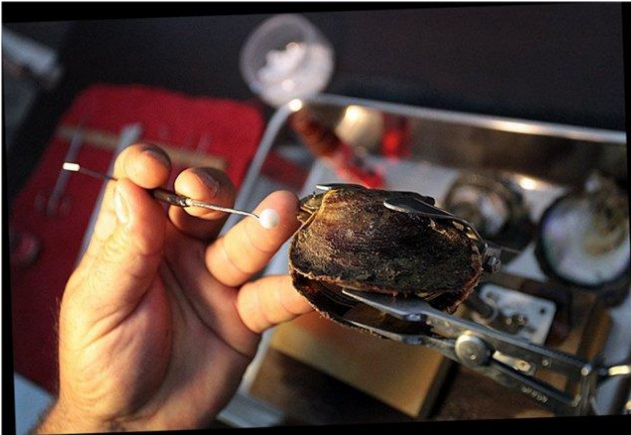
Рисунок – Помещение в раковину моллюска инородного тела[16]