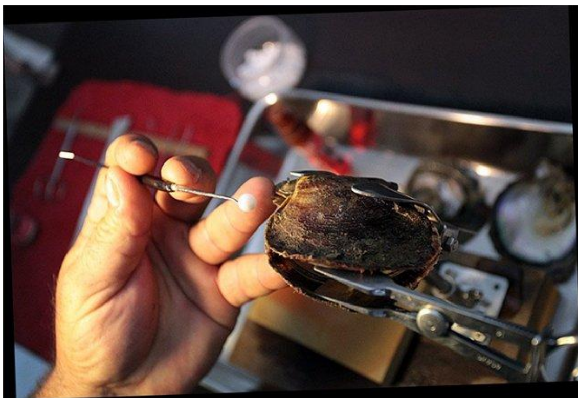
Рисунок – Высадка импланта [ 16 ]