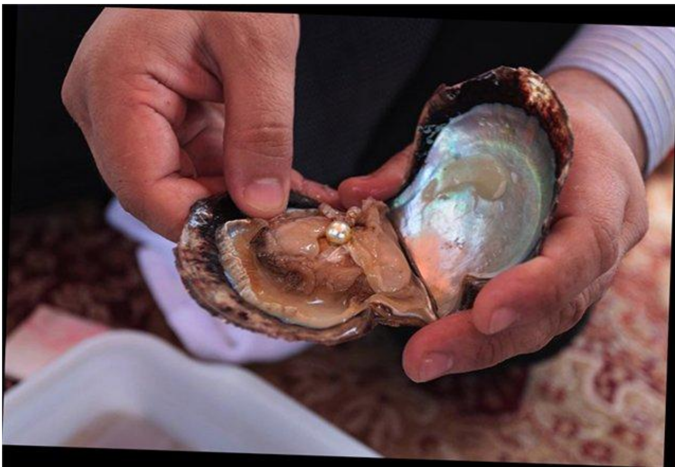
Рисунок – Выращенный жемчуг [16]