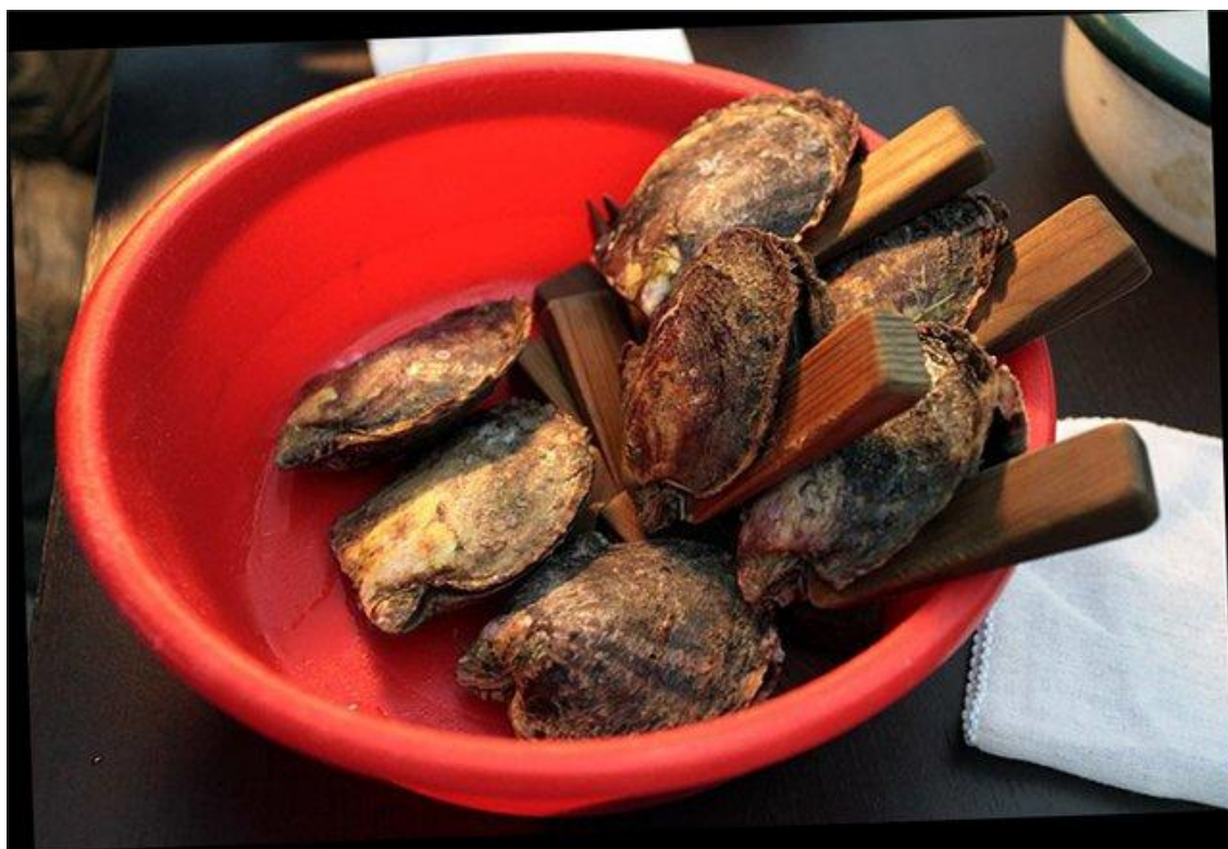
Рисунок – Раковины моллюсков с деревянным клином[ 16 ]

Раковины аккуратно раскрывают и вставляют в них КЛИН