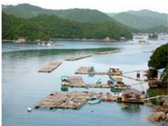
Рисунок – Современные фермы по выращиванию жемчуга. Китай