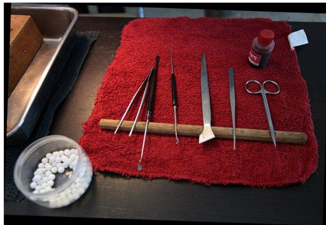
Рисунок – Приборы для введения затравки в мантию моллюска [ 16 ]