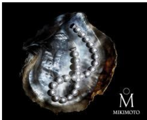
Рисунок - Современные изделия фирмы «Микимото»