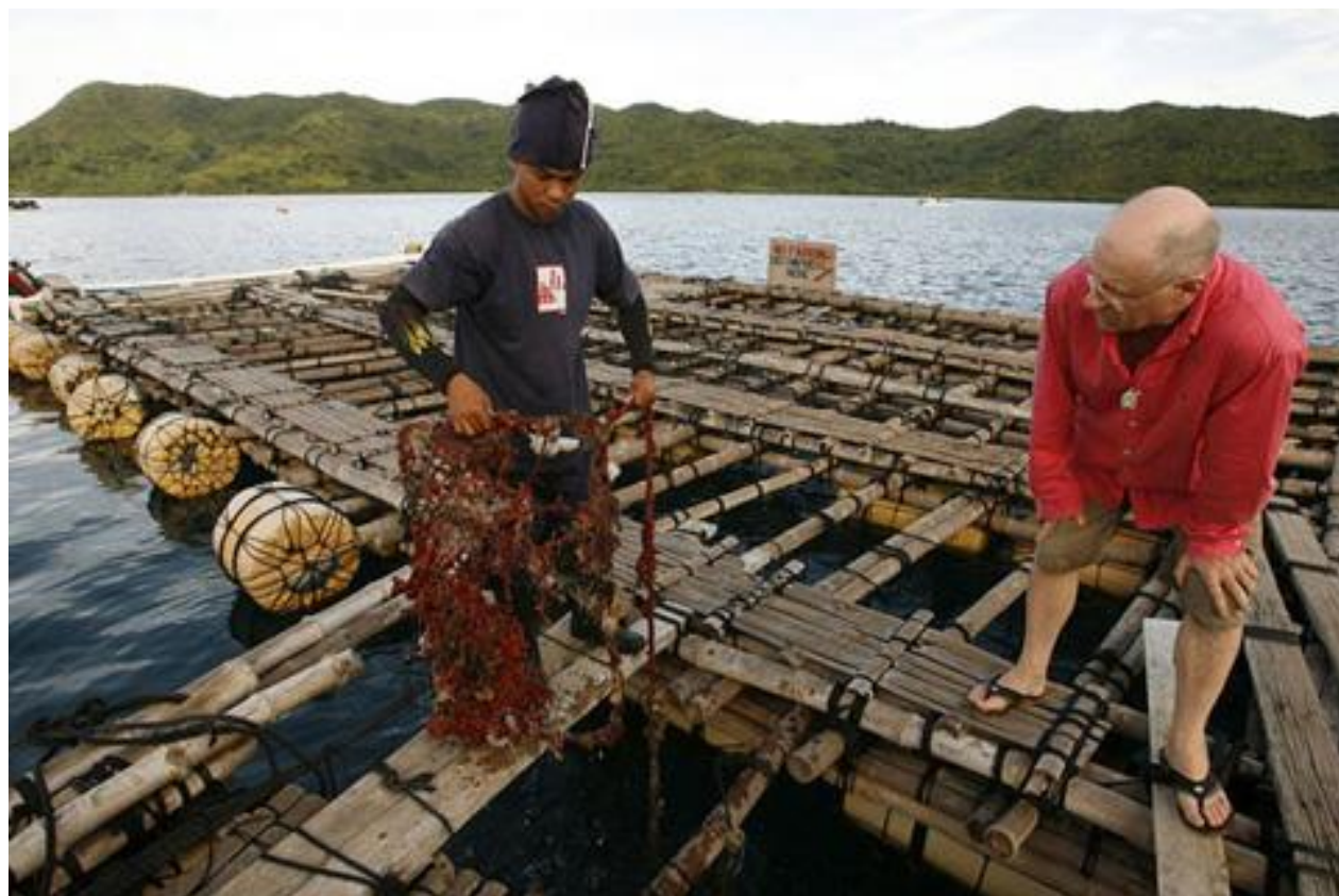
Рисунок – Снятие моллюсков с сети – «грядки» [1] Рисунок – Снятие моллюсков с сети – «грядки» [14]