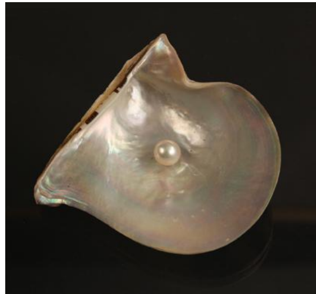
Рисунок – Выращенный жемчуг [4]