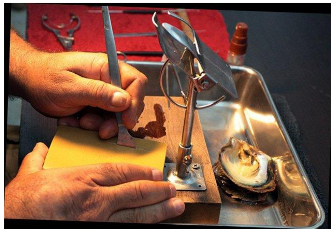
Рисунок – Подготовка к высадке импланта [ 16 ]