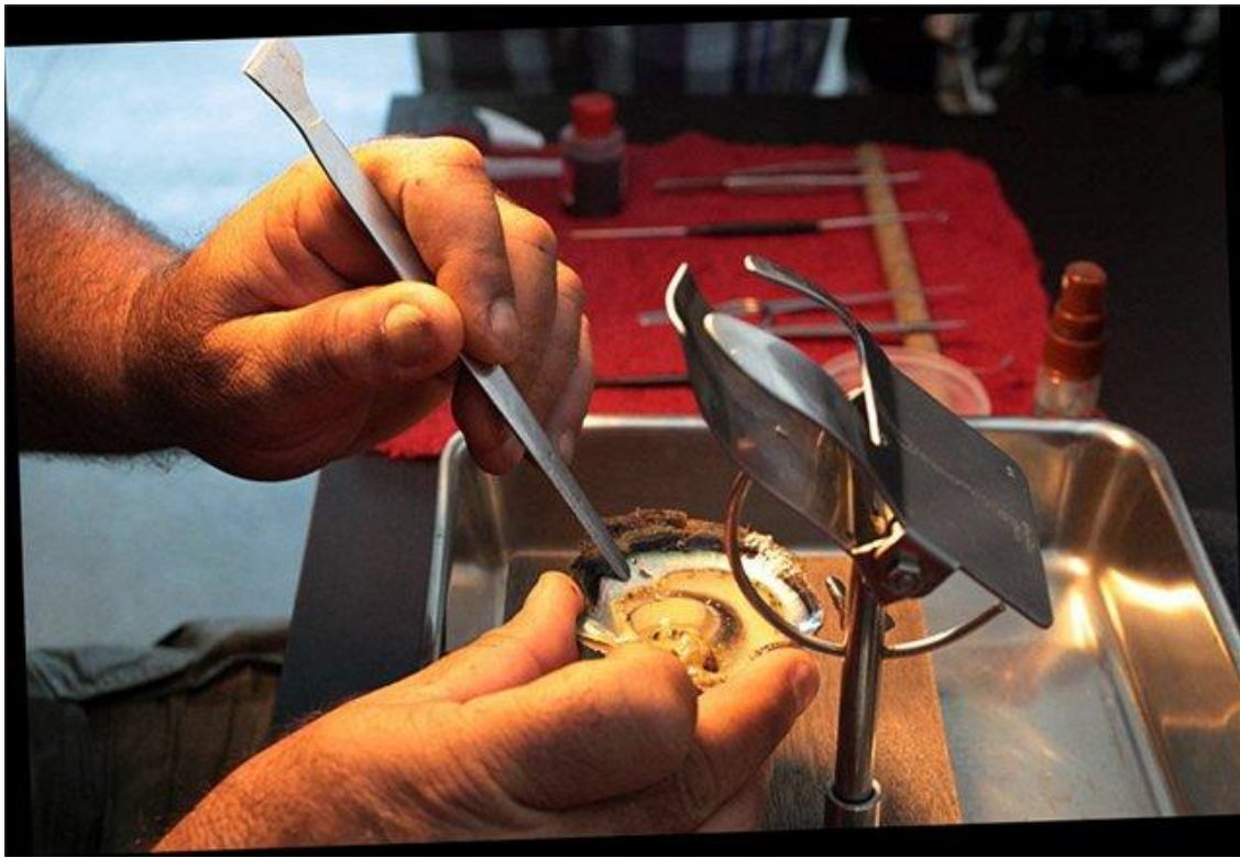
Рисунок – Раковина - донор[ 16 ]

Одна раковина будет донором. От нее отрезают кусочек мантии, который помещают потом на имплант. Он будет катализатором процесса.