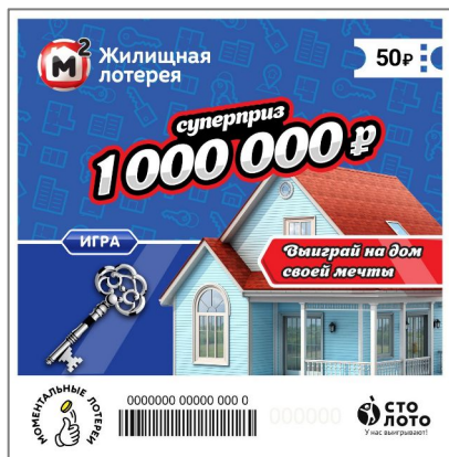
размер - 100x101,6 мм