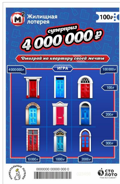
размер - 100x152,4 мм