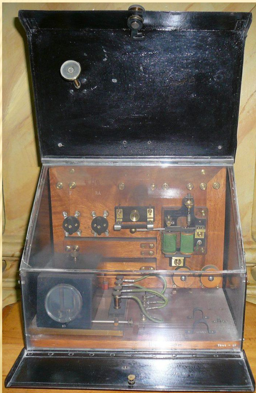
Радиостанция Попова 1901 г.