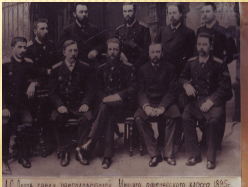
А.С. Попов среди преподавателей Минного офицерского класса 1895г.

1883 – 1901 служба в Минном офицерском классе Морского ведомства в Кронштадте