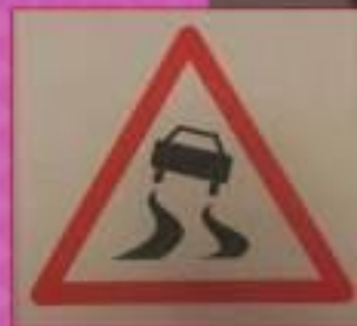
Осторожно, скользкая дорога