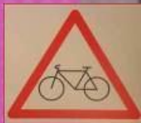
Знак, предупреждающий о наличии велосипедной дорожки