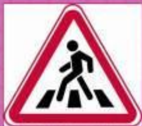
Знак, предупреждающий о наличии пешеходного перехода