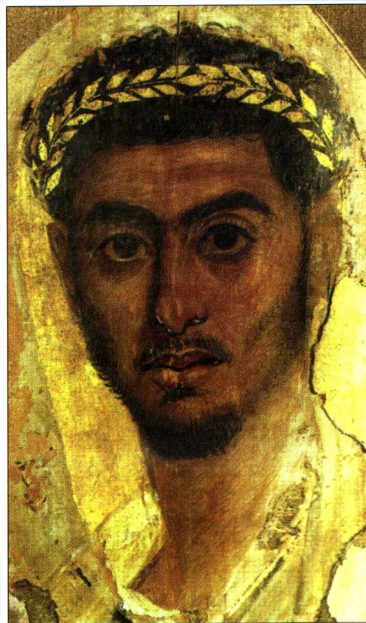
ПОРТРЕТ ЮНОШИ. Фаюмский портрет. Темпера. Древний Рим. I в.

При раскопках в Фаюме, около Каира, были найдены дощечки с портретами, выполненными восковыми красками. Перед поражёнными исследователями предстали ошеломляющие реалистичные образы людей, живших две тысячи лет тому назад. Их взор обращён к нам, в их образах явно преобладание духовного начала над телесным.