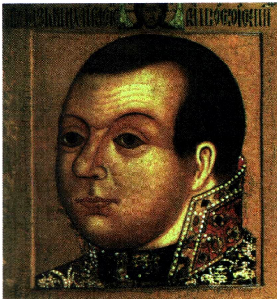
КНЯЗЬ М.В. СКОПИН-ШУЙСКИЙ. Парсуна. Темпера. Россия. XVII в.