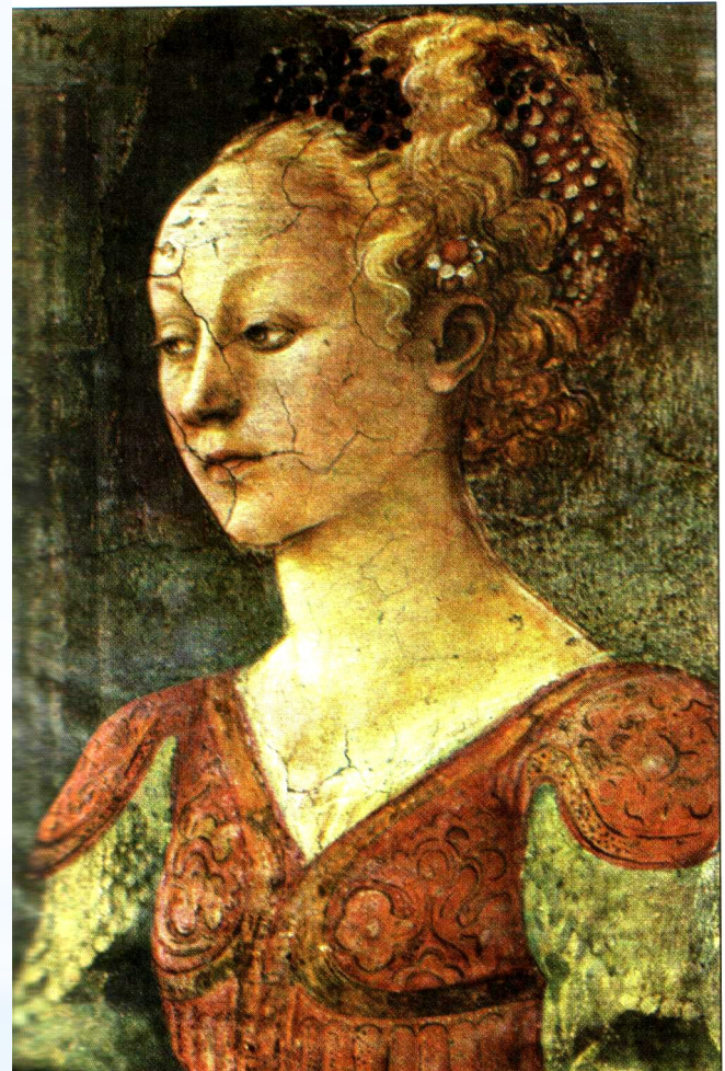
Фрагмент храмовой фреска. Италия. XV в.

Искусство донесло до нас лица разных эпох и народов. Мы видим их такими, какими они представляли себя, но каждое изображение для нас - нечто большее, чем сходство с одним человеком. В каждом образе можно увидеть идеалы эпохи, понимание окружающего мира, характер жизни. И это именно то, что мы особенно ценим в портретах. Понимание жизни художником обогащает наше понимание самих себя.