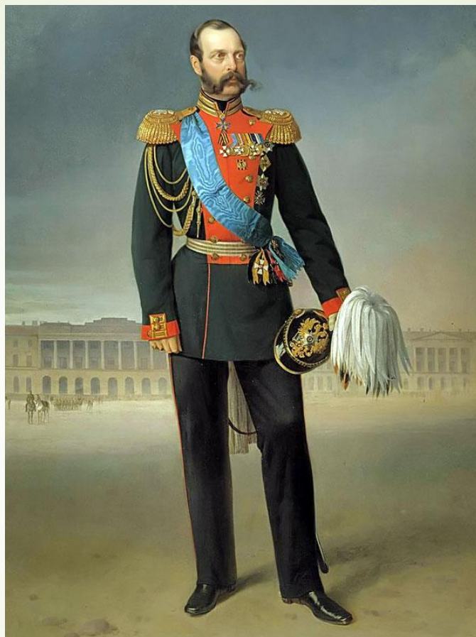
Александр II (1855-1881)