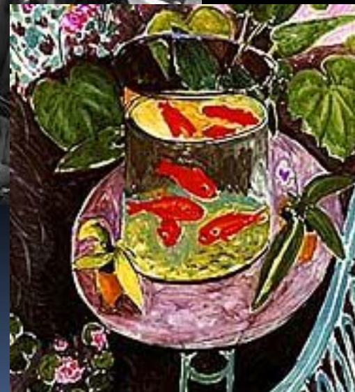
А. МАТИСС «КРАСНЫЕ РЫБКИ»