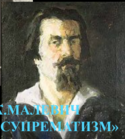
К. МАЛЕВИЧ «СУПРЕМАТИЗМ»