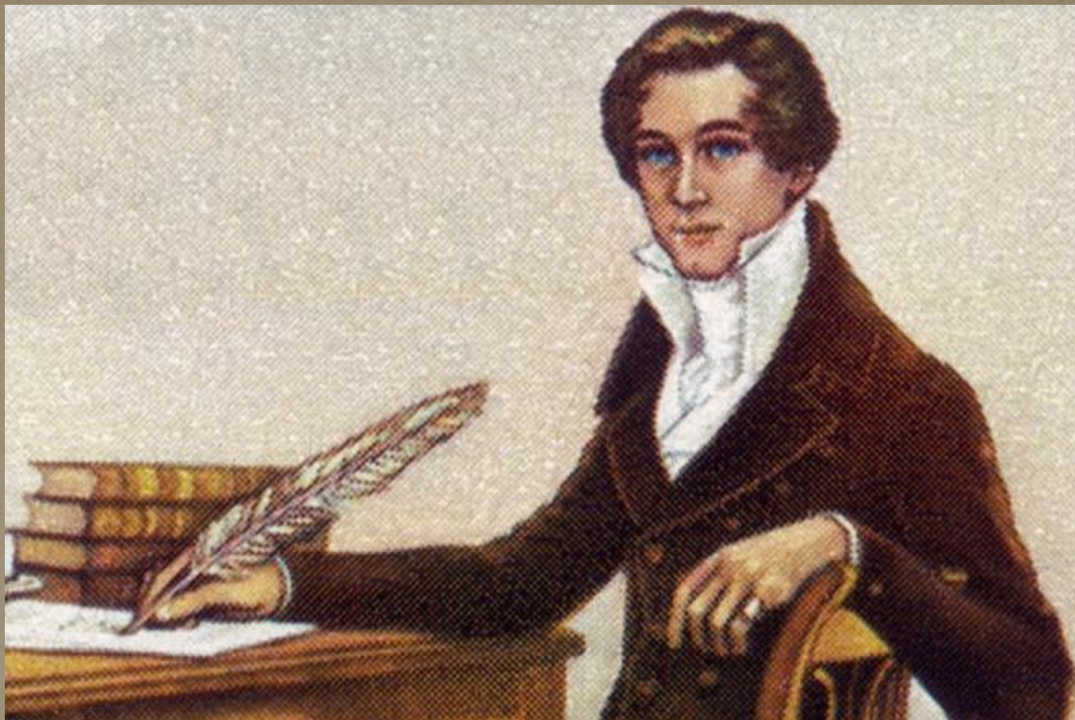
Писатель Вильгельм Гауф