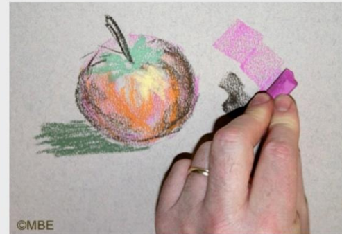
Использования края пастели.