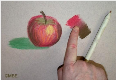
Смешивание пастелей ( растушёвка ).

Её методы и вариации творческого применения.