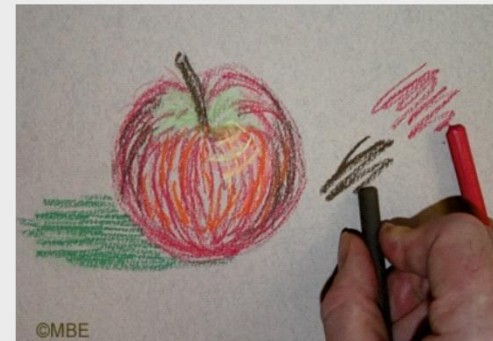
Рисунок кончиком пастели