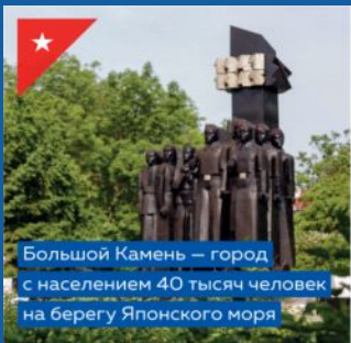
Большой Камень – город с населением 40 тысяч человек на берегу Японского моря