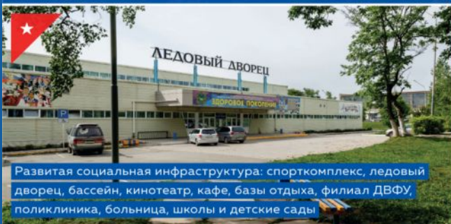
Развитая социальная инфраструктура: спорткомплекс, ледовый дворец, бассейн, кинотеатр, кафе, базы отдыха, филиал ДВФУ, поликлиника, больница, школы и детские сады

Приморский край, г. Большой Камень Живи, работай, отдыхай!