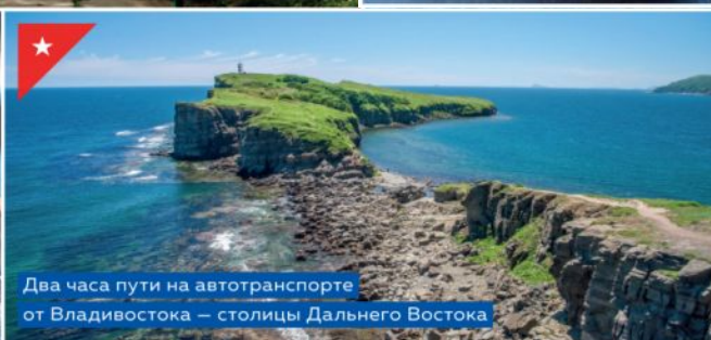
Два часа пути на автотранспорте от Владивостока – столицы Дальнего Востока