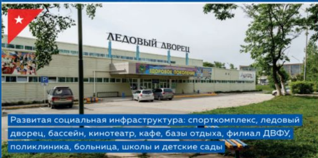
Развитая социальная инфраструктура: спорткомплекс, ледовый дворец, бассейн, кинотеатр, кафе, базы отдыха, филиал ДВФУ, поликлиника, больница, школы и детские сады

Приморский край, г. Большой Камень Живи, работай, отдыхай!