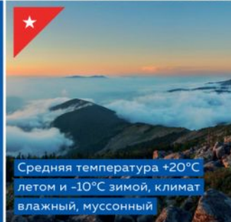
Средняя температура +20°C летом и -10°C зимой, климат влажный, муссонный

Приморский край, г. Большой Камень Живи, работай, отдыхай!