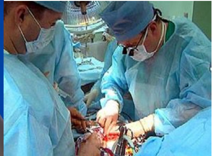
Фото с операции в Новосибирске с использованием этого протеза