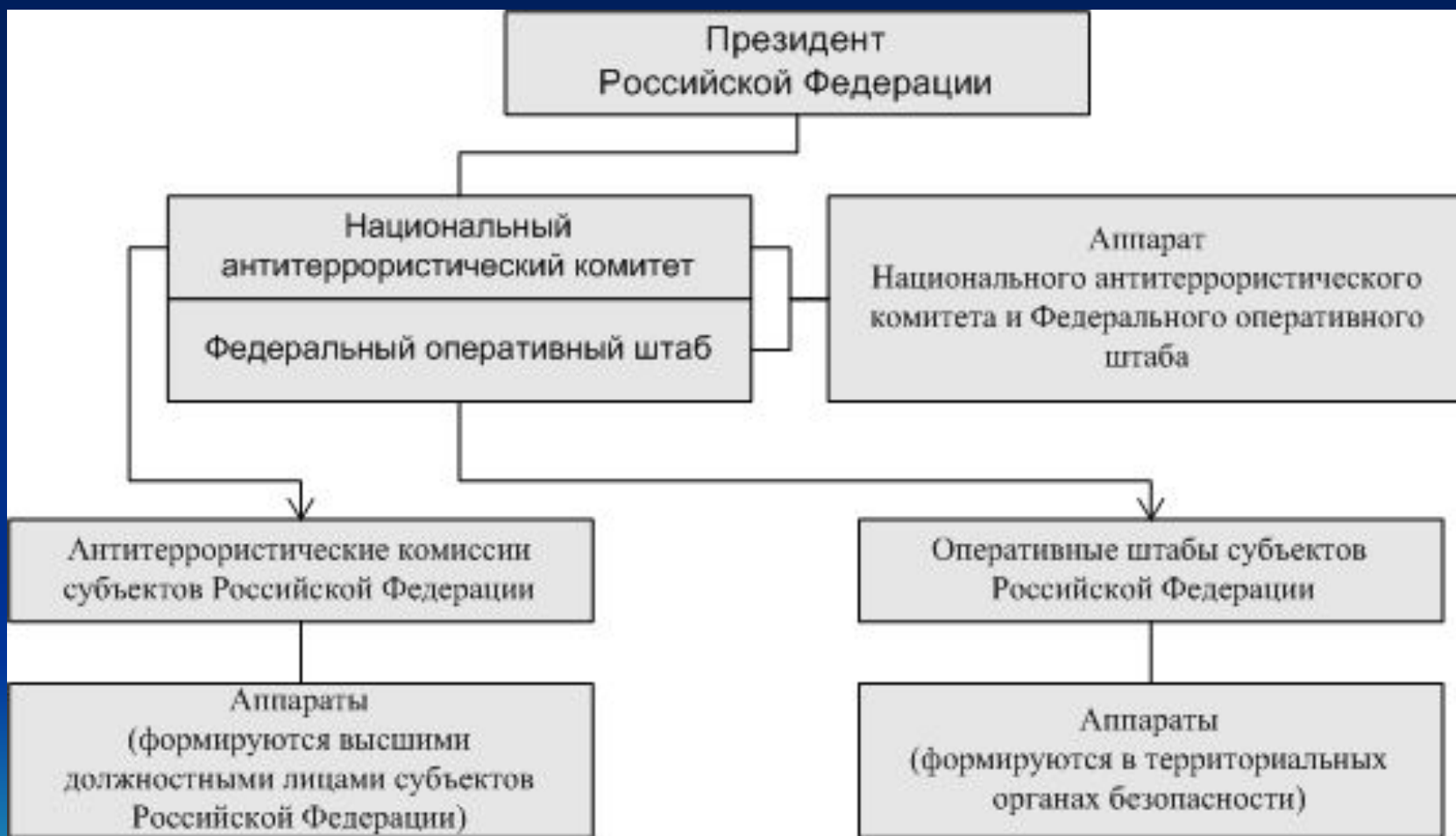
Схема координации деятельности противодействия терроризму в Российской Федерации