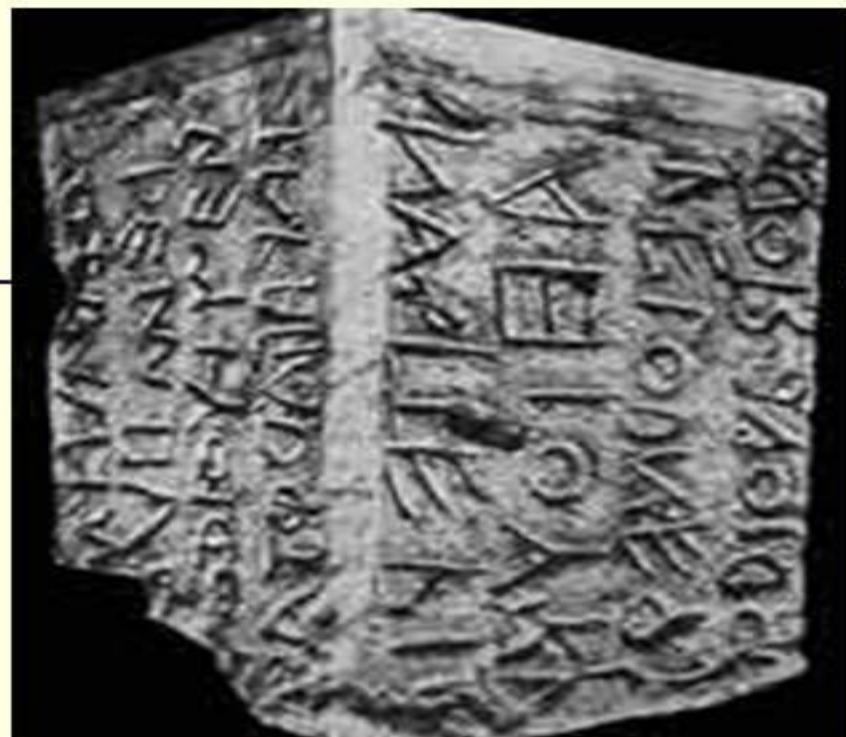
Древнейший латинский текст найден не в Риме, а в древнем городе Пренесте («пренестинская застёжка» или «фибула»).

Надписей до-литературного периода осталось очень немного. В самом Риме быстрый рост города и его материальной культуры создавал условия, не способствовавшие сохранению старинных памятников, а за пределы Лация в раннюю эпоху латинская письменность еще не выходила.