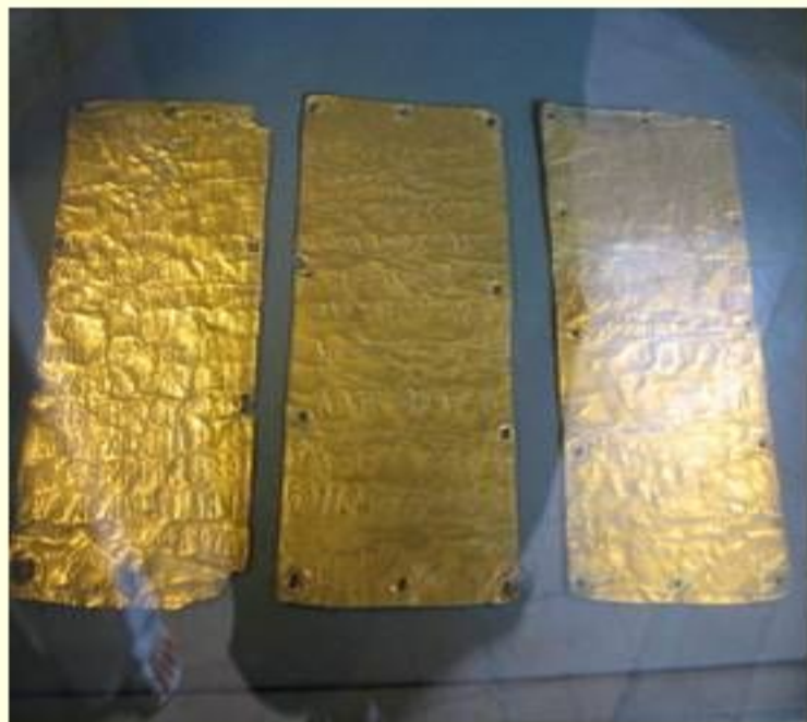
Этрусский текст на золотых табличках из Пигри (совр. Санта Севера, Лацио)

Разрастающемуся государству требуется письменность. Сначала приняли у этрусов символную письменность, но не смогли её освоить и приняли греческую фонетическую письменность .