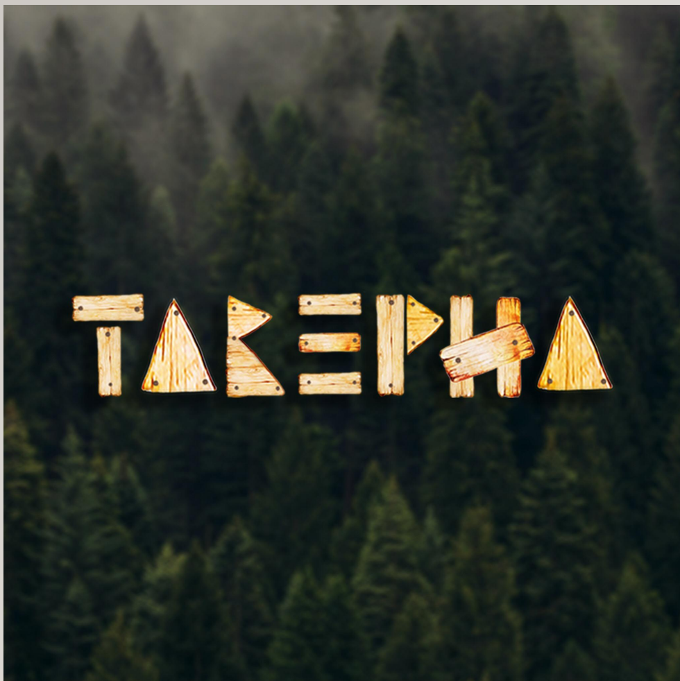
Логотип группы "Таверна"