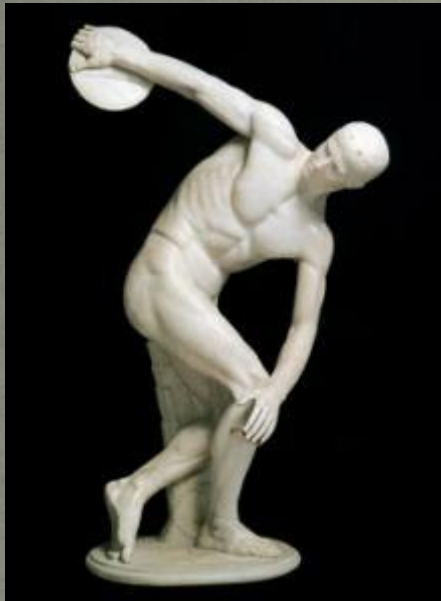
Мирон. Дискобол. Древняя Греция