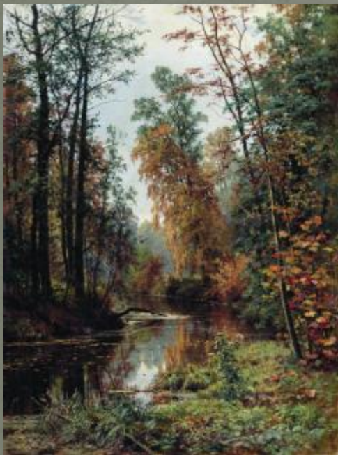
И. Шишкин. Парк в Павловске.