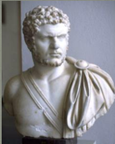
Портрет императора Каракаллы. Древний Рим