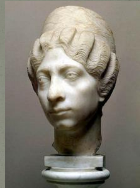
Портрет сирийки. Древний Рим