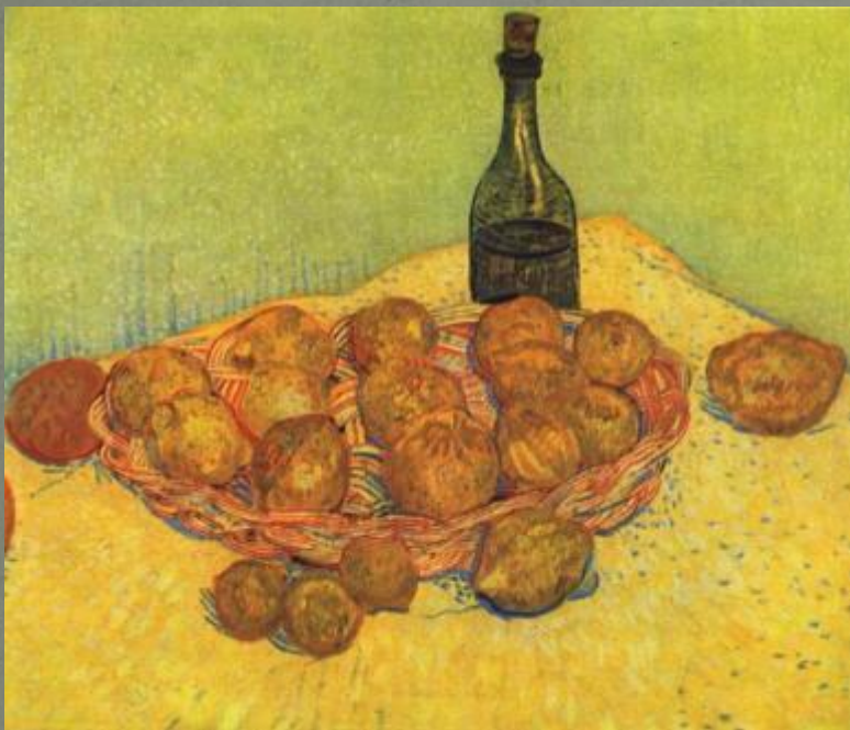
В. Ван Гог. «Натюрморт с бутылкой, лимонами и апельсинами».