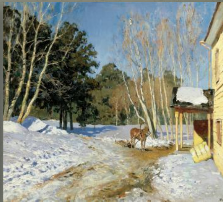
И. Левитан. Март.