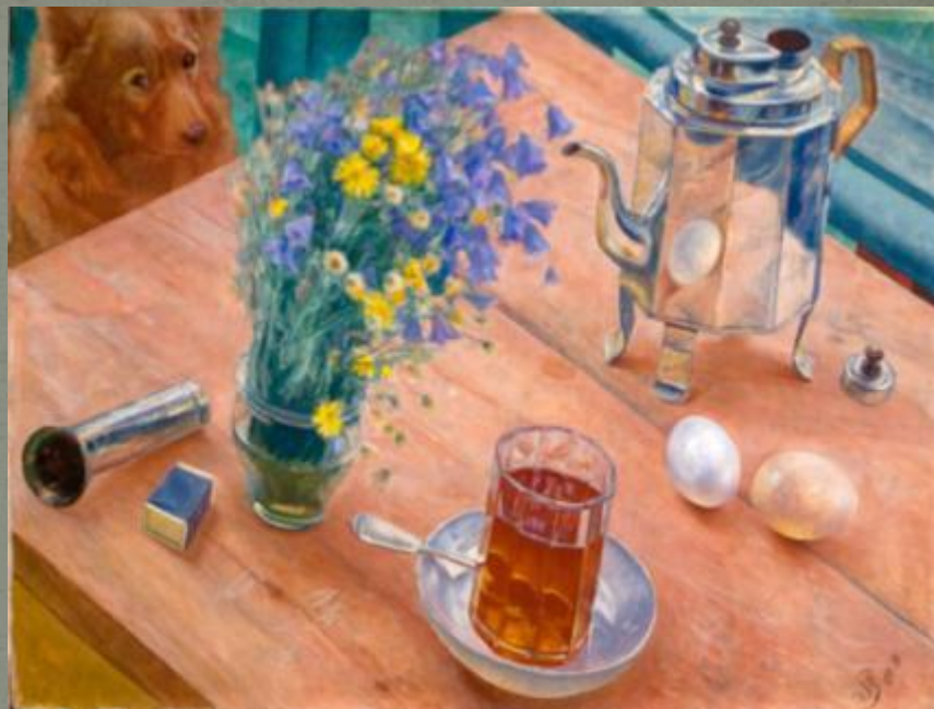
К. Петров-Водкин. «Утренний натюрморт».