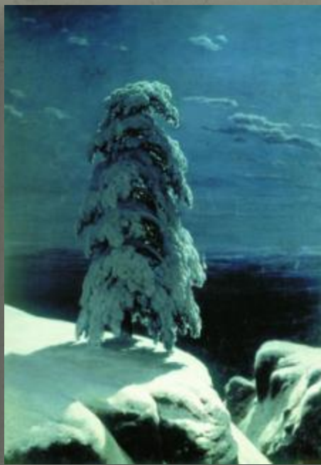
И. Шишкин. На севере диком.