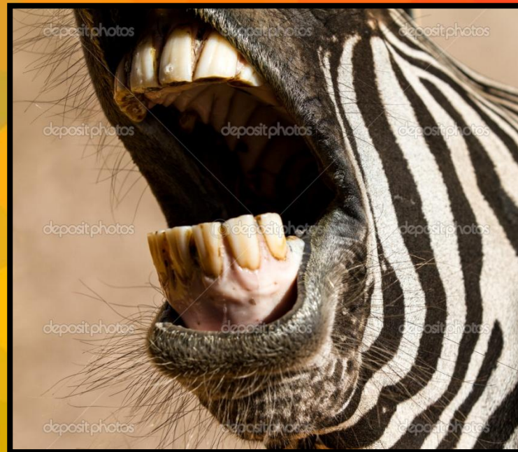
Зуби рослиноїдних видів