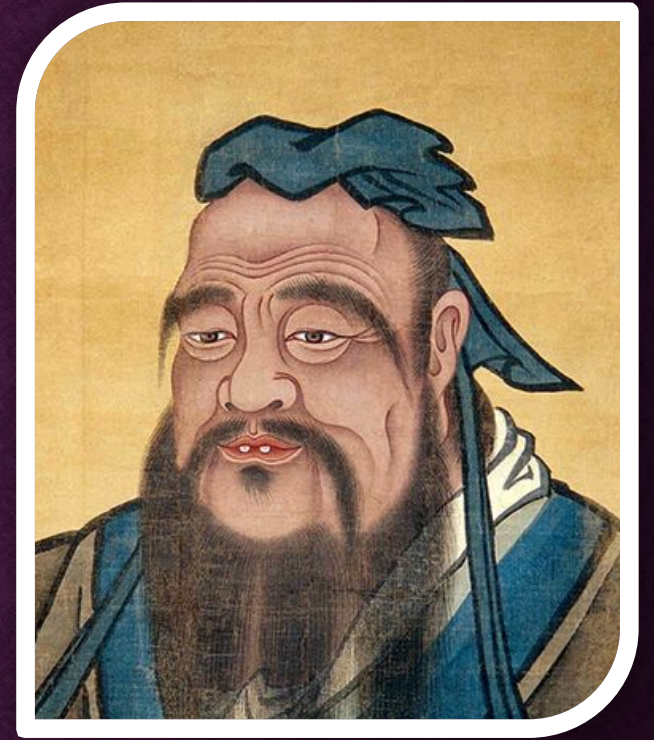
Конфу́ций (551 - 479 год до н. э.)

Нравственные принципы, социальные отношения, проблемы государственного управления — главные темы в учении Конфуция. Что же касается уровней знания, то он проводит следующую градацию: “Высшее знание — это врожденное знание. Ниже — знания, приобретенные учением. Еще ниже — знания, приобретенные в итоге одоления трудностей. Наиболее ничтожен тот, кто не желает извлекать поучительные уроки из трудностей”. Итак, можно с полным основанием утверждать, что Лаоцзы и Конфуций своим философским творчеством заложили прочный фундамент для развития китайской философии на многие века вперед.