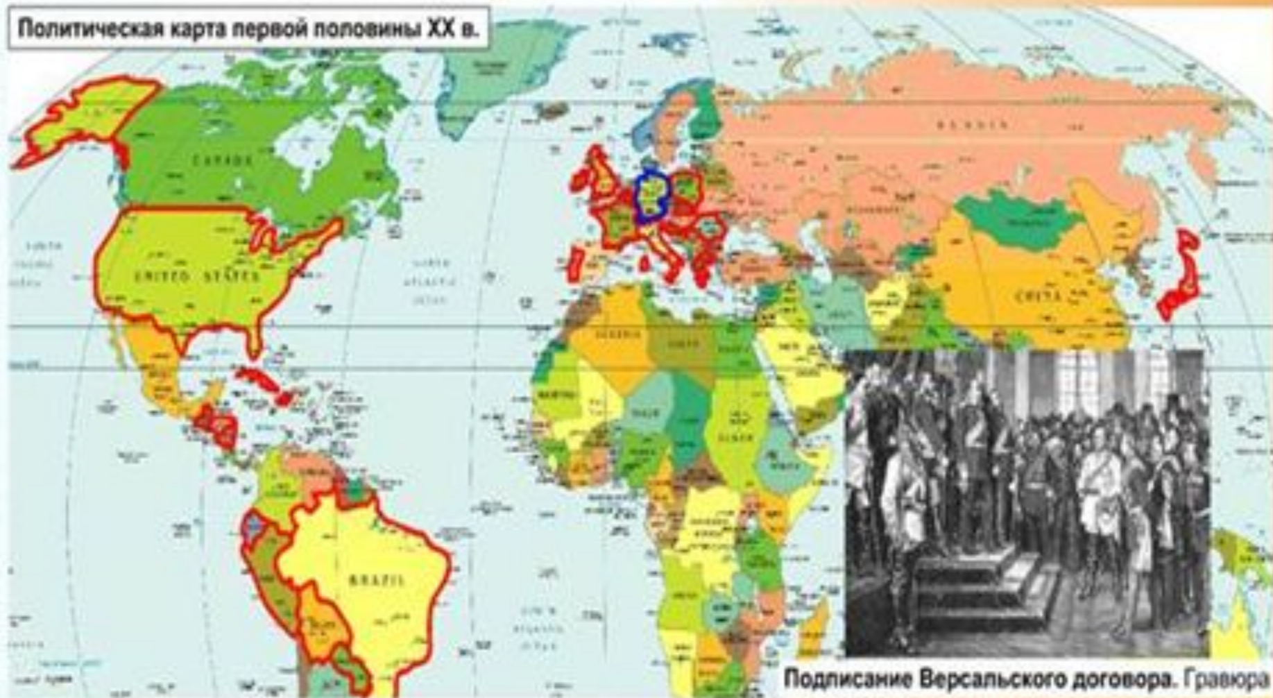
Подписание Версальского договора. Гравюра

Политическая карта первой половины XX в.