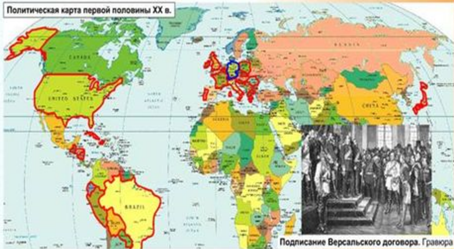
Подписание Версальского договора. Гравюра

Политическая карта первой половины XX в.