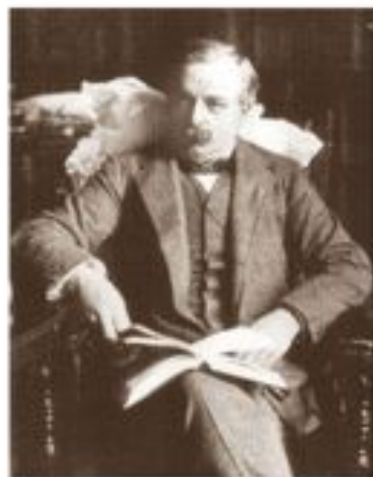
Дэвид Ллойд Джордж