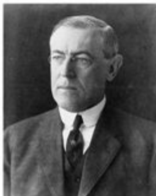
Томас Вудро Вильсон