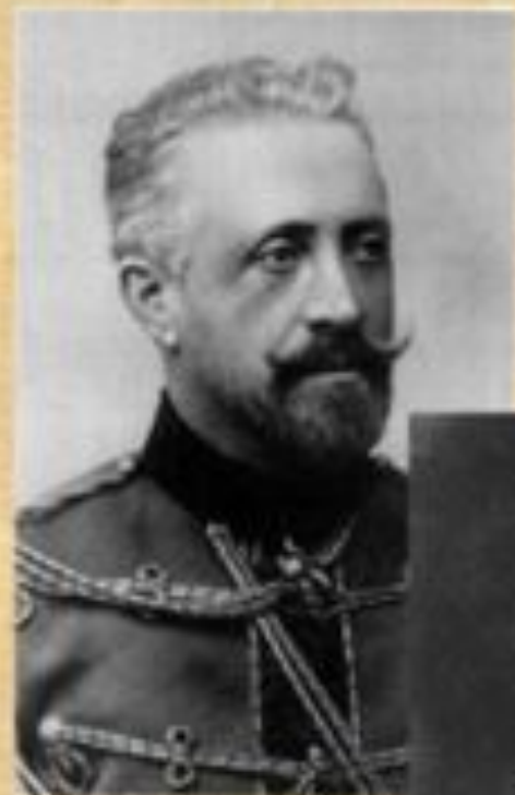
Великий князь Николай Николаевич