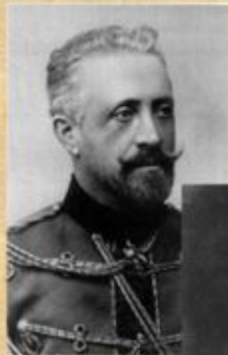
Великий князь Николай Николаевич