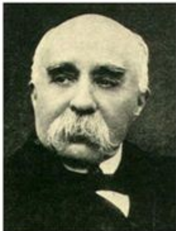
Жорж Бенжамён Клемансо