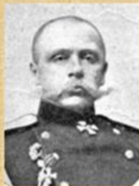
РЕННЕНКАМПФ Павел- Георг Карлович фон