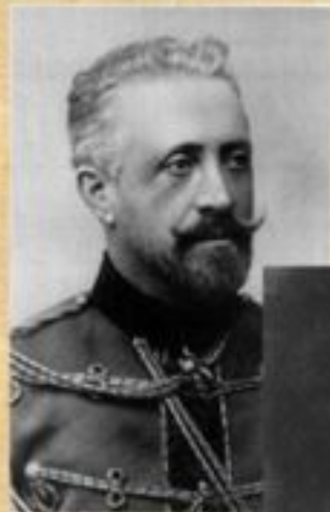
Великий князь Николай Николаевич