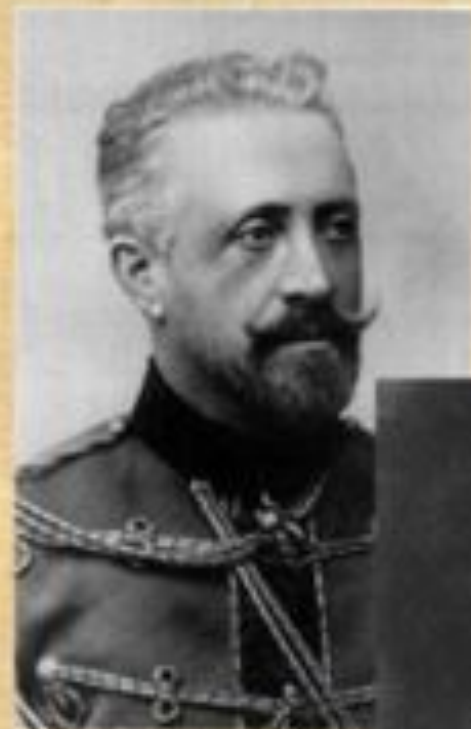
Великий князь Николай Николаевич