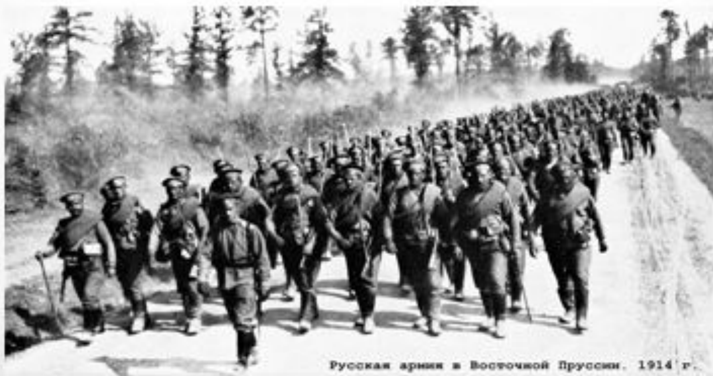
Русская армия в Восточной Пруссии, 1914 г.