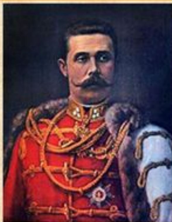
Эрцгерцог Франц Фердинанд