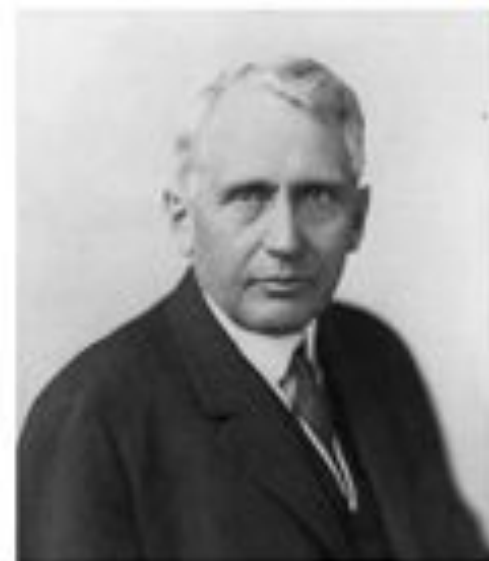
Гос.серктарь США Ф.Келлог