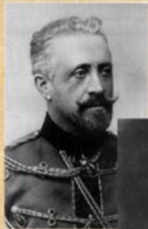
Великий князь Николай Николаевич