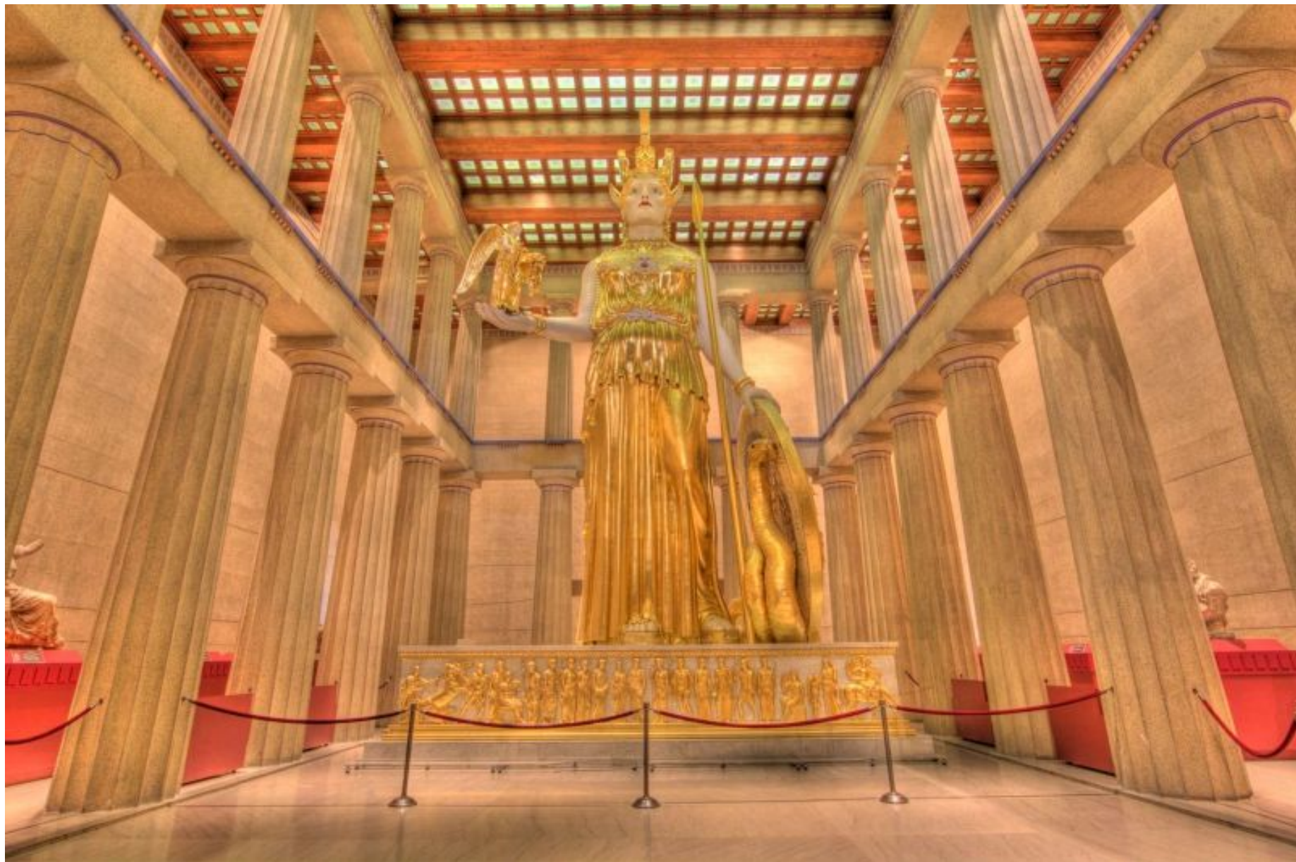
Парфенон. Реконструкция внутреннего убранства