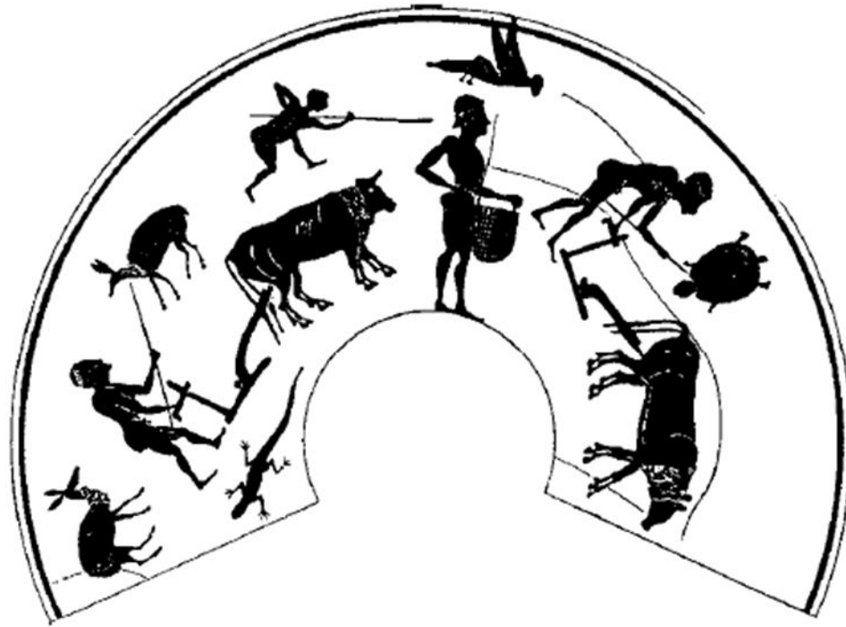
Пахари. Роспись на чернофигурной чаше