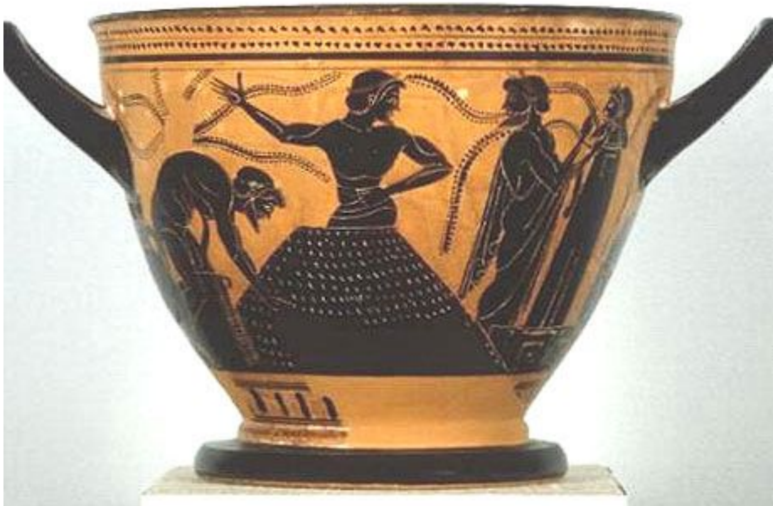
Аттический краснофигурный скифос (V в. до н. э.)