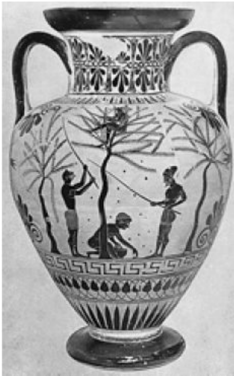
«Сбор оливок». Чернофигурная амфора