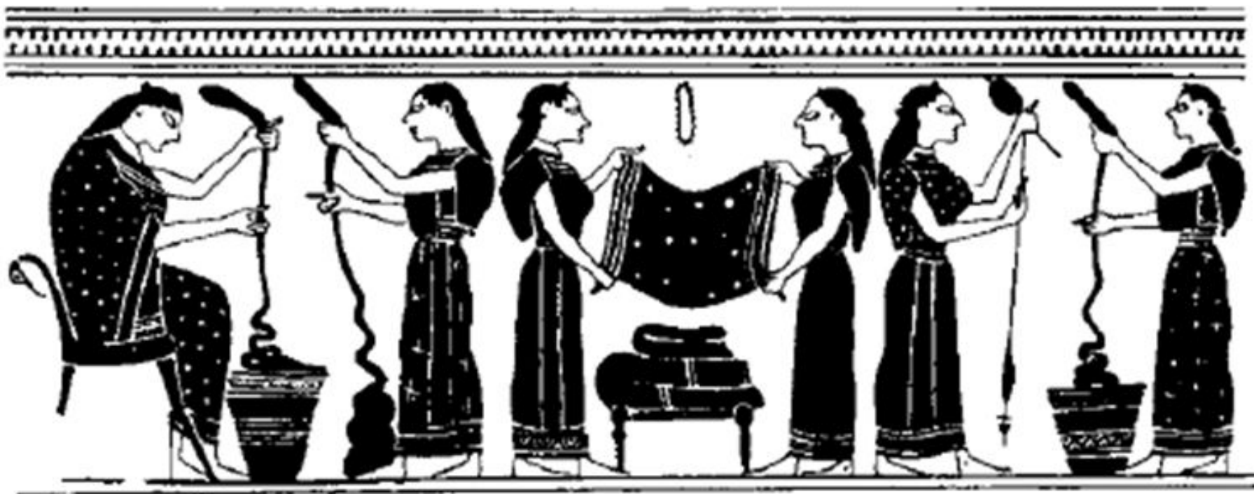
Женщины прядут и складывают покрывала. Рисунок на вазе