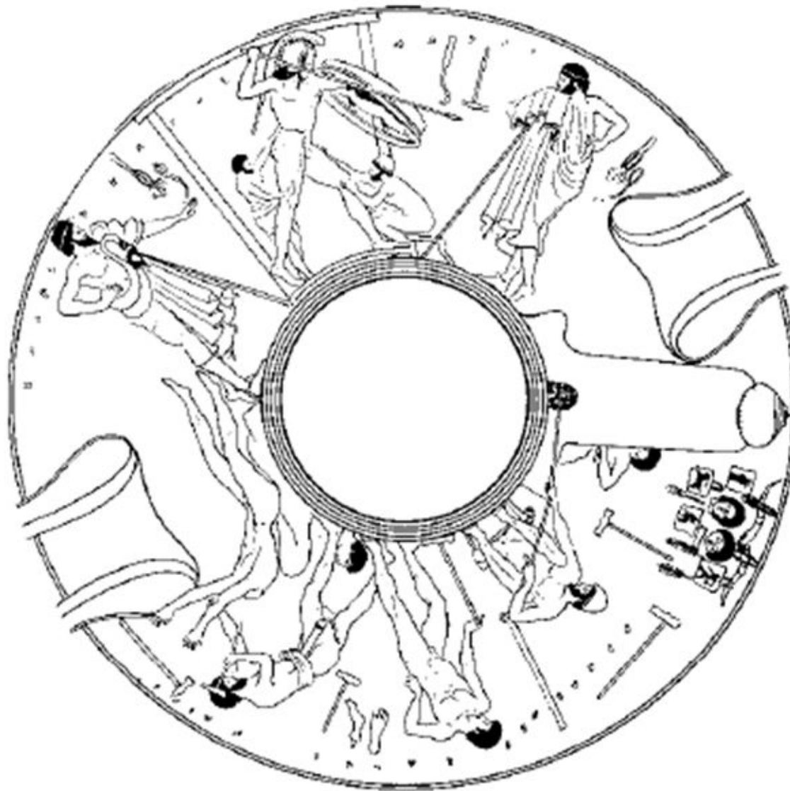
Бронзолитейная мастерская. Рисунок на вазе (V в. до н. э.)