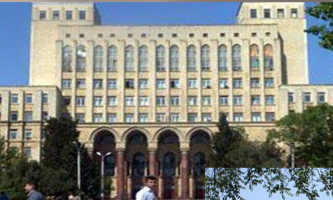
Иранская национальная Академия литературы и языка