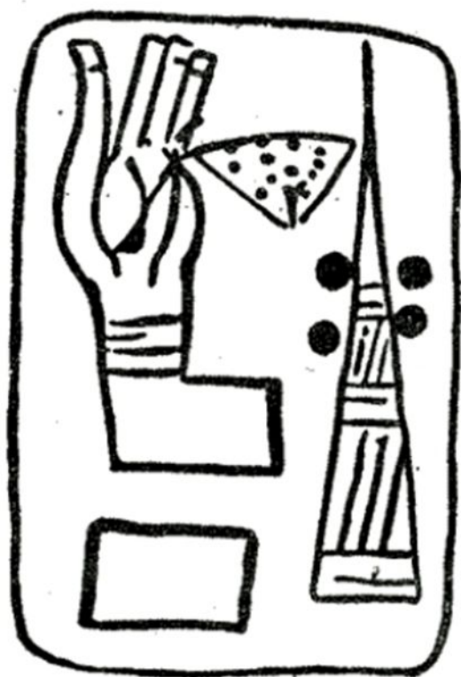
Древнейший шумерский пиктографический документ. Около XXXIII в. до н. э. Камень.