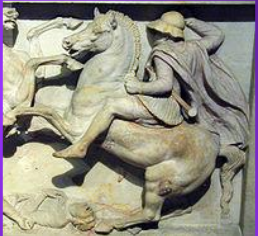
Македонский кавалерист с саркофага Александра Великого (IV в. до н. э.)