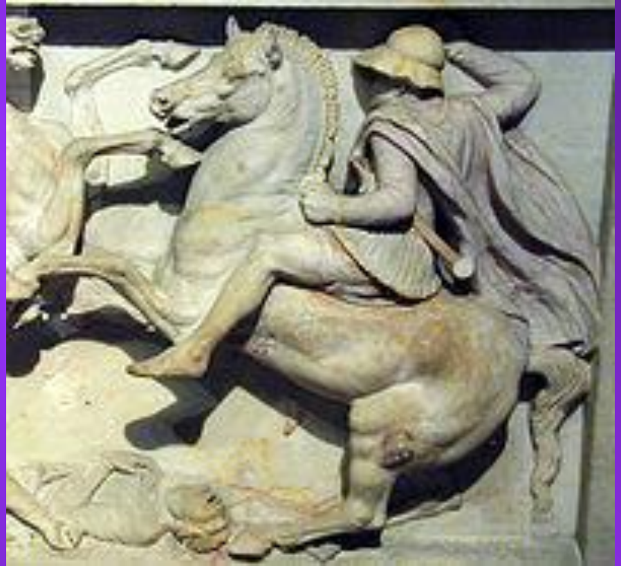
Македонский кавалерист с саркофага Александра Великого (IV в. до н. э.)