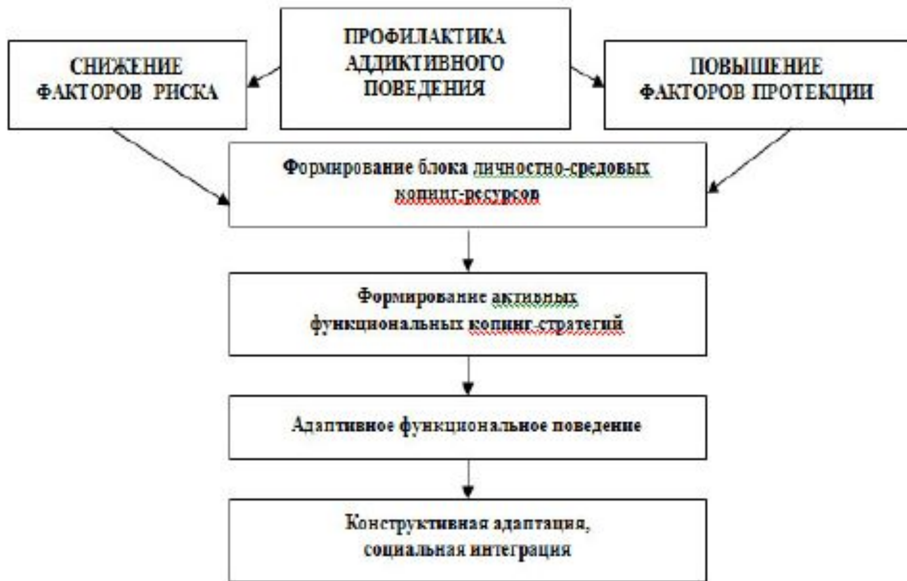
Рисунок 3 Первичная психолого-педагогическая профилактики аддиктивного поведения