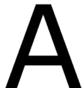
Шрифт без засечек

МЕЖБУКВЕННОЕ РАССТОЯНИЕ МЕЖБУКВЕННОЕ РАССТОЯНИЕ +2px МЕЖБУКВЕННОЕ РАССТОЯНИЕ +3px