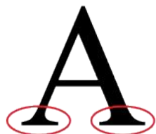
Шрифт с засечками