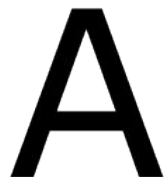
Шрифт без засечек

МЕЖБУКВЕННОЕ РАССТОЯНИЕ МЕЖБУКВЕННОЕ РАССТОЯНИЕ +2px МЕЖБУКВЕННОЕ РАССТОЯНИЕ +3px