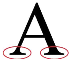
Шрифт с засечками