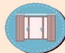
Закрыть окна и балкон