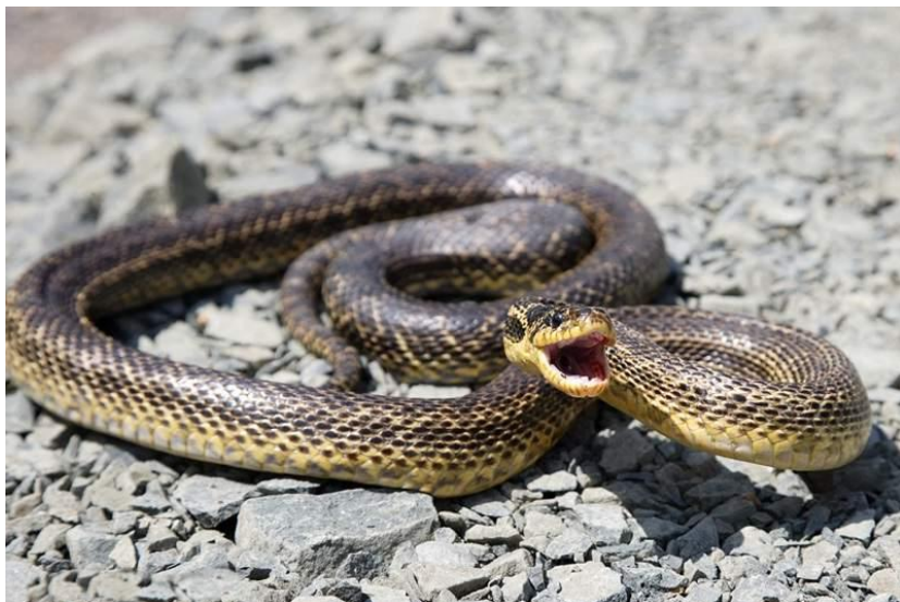
Elaphe sauromates poles