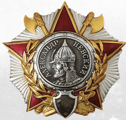
Орден Александра Невского № 877