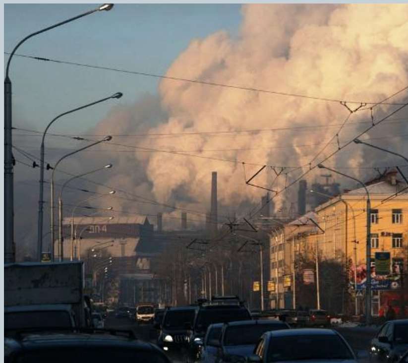
Выбросы химических веществ в атмосферу заводом КМК.

Новокузнецк входит в пятерку городов по химическому загрязнению атмосферы. Новокузнецк – промышленный гигант. В городе 42 предприятия, загрязняющих атмосферу.