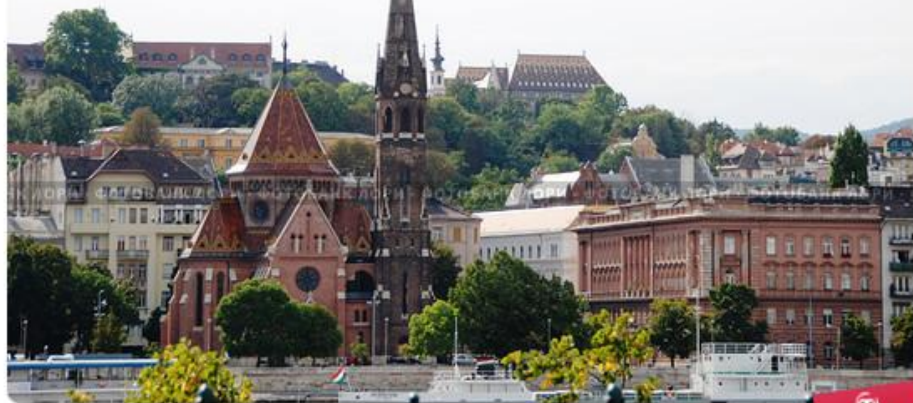
Кальвинистская (реформатская) церковь в Будапеште. Венгрия