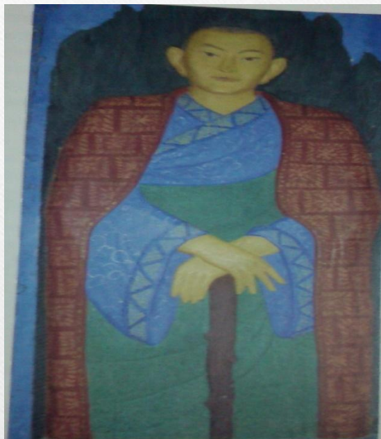
Зая-пандита — основатель ойратской калмыцкой письменности. Образ, созданный заслуженным художником РСФСР Владимиром Васькиным. 1971. Национальный музей Республики

Зая-Пандит моңһл келн улсин дунд шар шажна ном делгүллһнд, ни-негн бәәлһнд ик ач- тусан күргсмн.