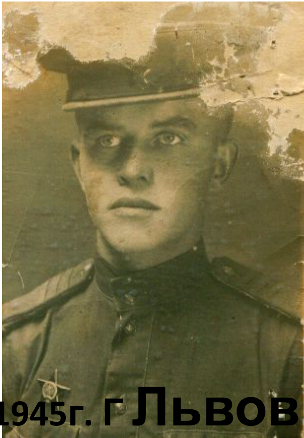
1945г. Г ЛЬВОВ

«Пускай у писем далека дорога, но мне от писем хорошо моих ведь эти письма я руками трогал, и ты читая, будешь трогать их...»