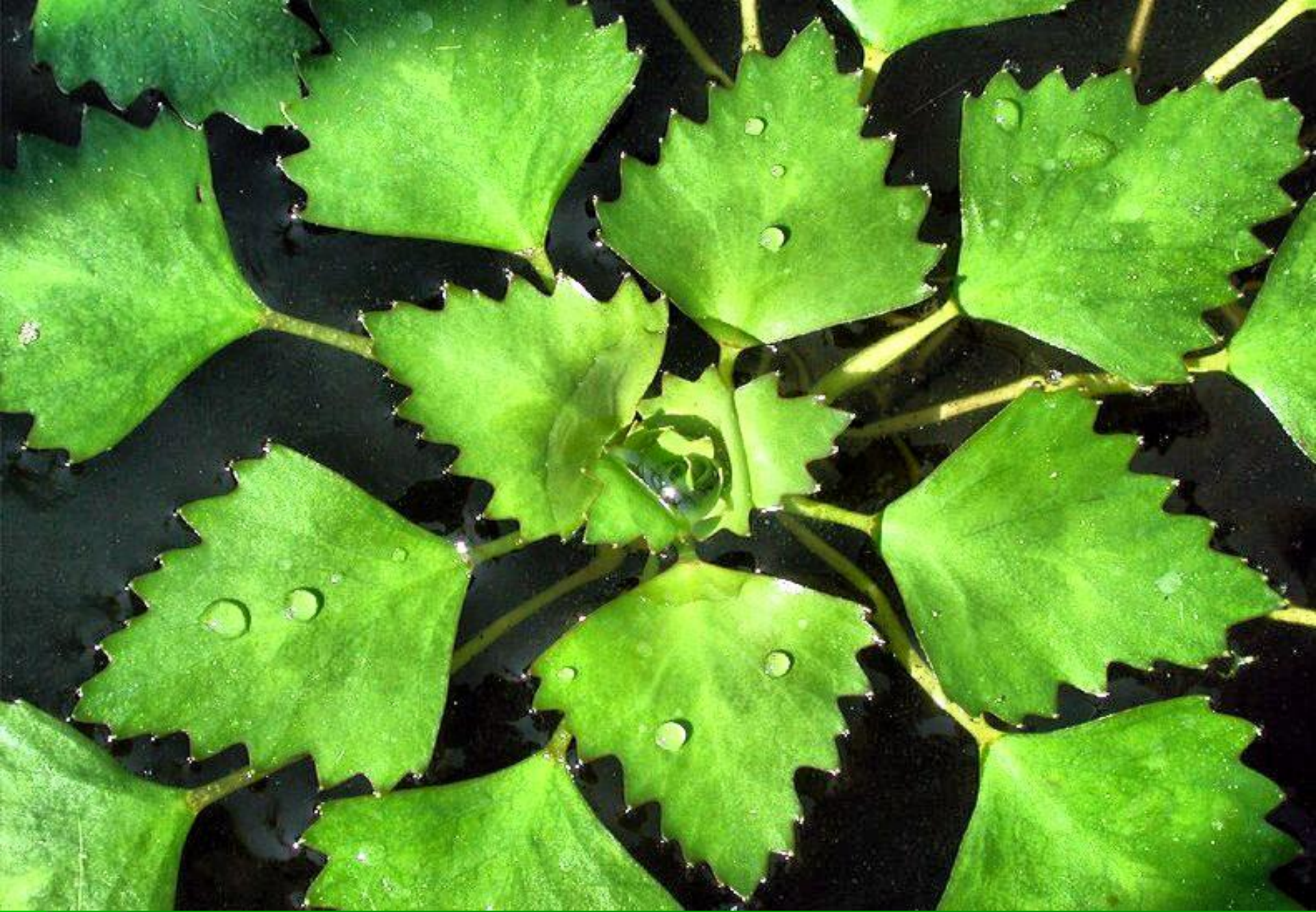
Водяной орех (рогульник)