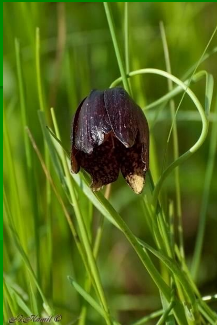
А. Kamil ©