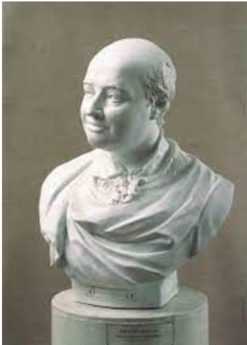
Портрет М.В. Ломоносова - Шубин Ф. И.