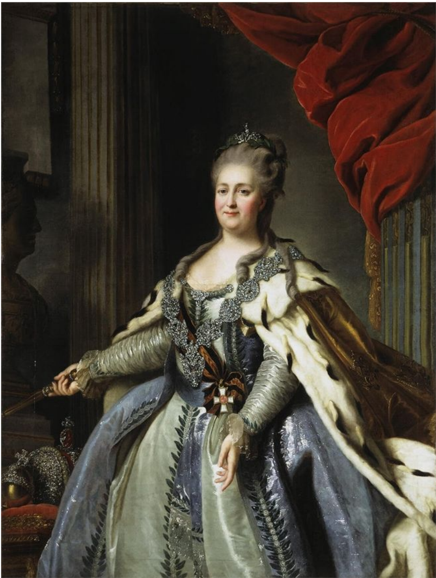
Фёдором Степановичем Рокотовым выполнены парадные портрет