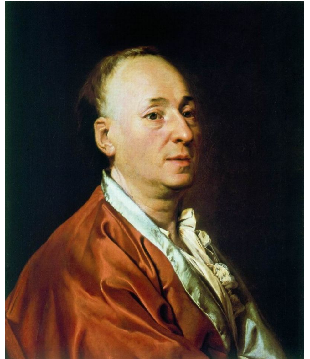
Кисти Левицкого принадлежит портрет знаменитого Д. Дидро.