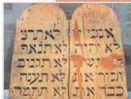
Изображение скрижалей Моисея

Иисусу Христу принадлежит краткая формулировка всех тех заповедей, которые ранее были даны человечеству. В Евангелии рассказывается, что однажды к нему подошёл один человек, который посвятил много лет своей жизни изучению Священного писания, и спросил Иисуса, какая заповедь самая важная среди всех многочисленных предписаний, содержащихся в иудейском законе. На это Иисус ответил, что есть две самые главные заповеди, на которых основано всё Священное писание. Первая из них — «возлюби Господа Бога твоего всем сердцем тво-