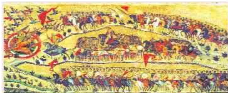
Церковь воинствующая. Русская икона XVI в.

Мы помним, что в основе христианства лежит уверенность в том, что на земле родился Сын Божий — Иисус Христос. Коль скоро Христос жил среди людей, о нём можно не только написать в книге, но его можно и изобразить. Очень скоро среди христиан получили распространение изображения Христа, его матери Марии и святых. Эти изображения стали называть иконами (от греческо-