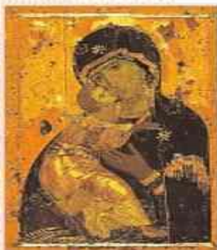
Владимирская икона Божией Матери

П ри входе в храм или в молитвенный дом любой религии мы часто обращаем внимание на прекрасные предметы, которые находятся в этом священном месте. В большинстве случаев предметы искусства, находящиеся здесь, связаны с учением той религии, в храме которой мы находимся. Искусству часто придаётся особый религиозный смысл.