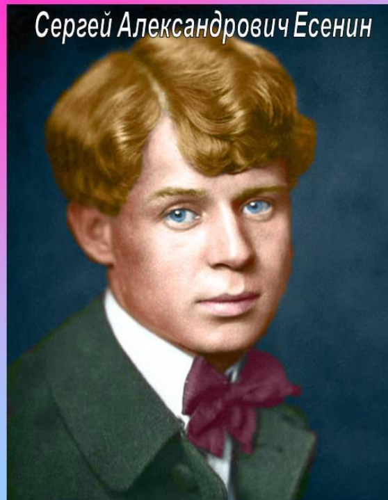
Сергей Александрович Есенин

Душа поэта - тонкая струна, Дотронешься - и зазвучит она! И мир Есенина нам предстоит постигнуть, В секреты слова красоты проникнуть.